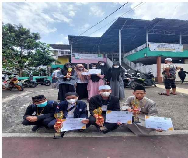
Gambar 2. Prestasi anak-anak beasiswa saat mengikuti Lomba MHQ,MTQ,dan Adzan

“Alhamdulillah untuk beasiswa sendiri ada pengaruh nya untuk prestasi yang sudah saya capai,saya jadi merasa punya tanggung jawab terhadap hafalan yang saya punya,dan karena untuk mempertahankan beasiswa salah satu syarat nya setiap semester harus setoran hafalan sebanyak 5 juz, jadi karena beasiswa juga hafalan saja lebih terjaga dan keberkahan Al-Qur’an mempermudah saya untuk melakukan aktivitas”