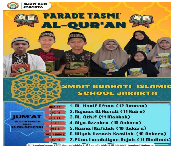
Gambar 3. Anak-anak beasiswa saat ingin mengikuti parade tasmil

“Kalau untuk pengaruh beasiswa ya zah, di aku lebih ke kayak merasa punya tanggung jawab buat jaga hafalan karna klo di sia sia in jatohnya kan dzolim ya zah. jadi gitu klo prestasi di prestasi fiina juga bukan yang gimana gimana banget . jadi lebih ke ke sehari-harian aja si zah pengaruh beasiswa ini”