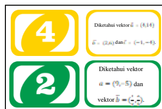
Gambar 4. Desain Kartu Soal

Kartu soal berukuran 8,5 cm x 5,5, cm dicetak pada kertas artpaper 210 gsm, sedangkan kunci jawaban dicetak pada kertas artpaper 120 gsm ukuran A3. Kartu soal berjumlah 32 kartu dan terdiri dari 8 kartu biru, 8 kartu hijau, 8 kartu merah, dan 8 kartu kuning. Masing-masing kartu memiliki nomor 1 sampai 4 dan masing-masing warna terdapat 2 kartu dengan nomor yang sama, serta terdiri dari 2 sisi. Bagian depan adalah poin sedangkan bagian belakang adalah soal. Semakin tinggi poin, maka semakin sulit soal yang diperoleh.