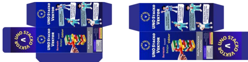
Gambar 1. Kemasan Bagian Luar

Kemasan UNO stacko terdiri dari kemasan bagian luar dan kemasan bagian dalam berwarna biru tua yang dicetak pada kertas artpaper 230 gsm. Kemasan bagian luar dari UNO stacko ini berukuran 9,5 cm x 9,5 cm x 25 cm, sedangkan kemasan bagian dalam berukuran 9 cm x 9 cm x 22 cm. Pada kemasan bagian luar terdapat judul permainan, keterangan isi, identitas pembuat, dan gambar yang dapat menarik minat peserta didik, sedangkan kemasan bagian dalam berisi petunjuk cara bermain serta keterangan yang terdapat pada balok dan kartu soal.