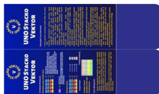
Gambar 2. Desain Kemasan Bagian Dalam

Balok UNO stacko yang digunakan dalam permainan ini adalah 36 buah yang terdiri dari 32 balok poin dan 4 balok ungu.