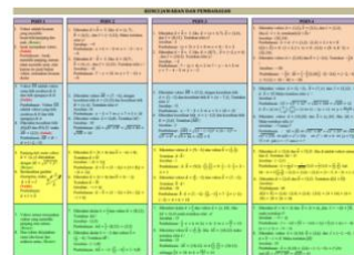
Gambar 5. Desain Kunci Jawaban