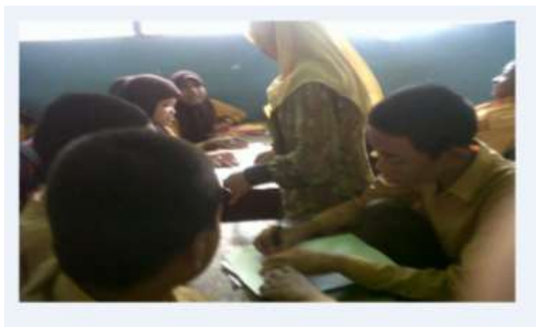
Gambar 2. Siswa Sedang Mengerjakan Soal

Pada saat melakukan observasi peneliti mempunyai dokumentasi berupa beberapa foto serta keterangan tentang foto pada saat berlangsungnya proses pembelajaran.