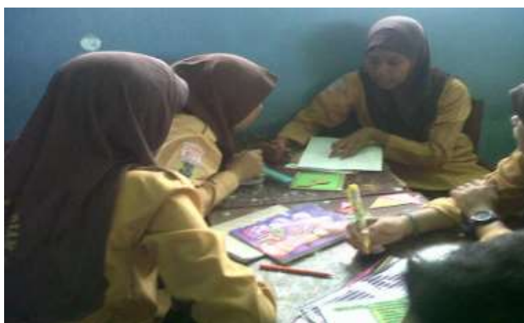
Gambar 4. Siswa Sedang Berdiskusi

Gambar di atas ini menerangkan tentang proses pembelajaran kelompok pada saat siswa sedang menyusun beberapa potongan tangram menjadi sebuah bangun datar untuk menyelesaikan soal latihan yang diberikan, disana terlihat semua siswa aktif dan bekerjasama dengan kelompoknya.