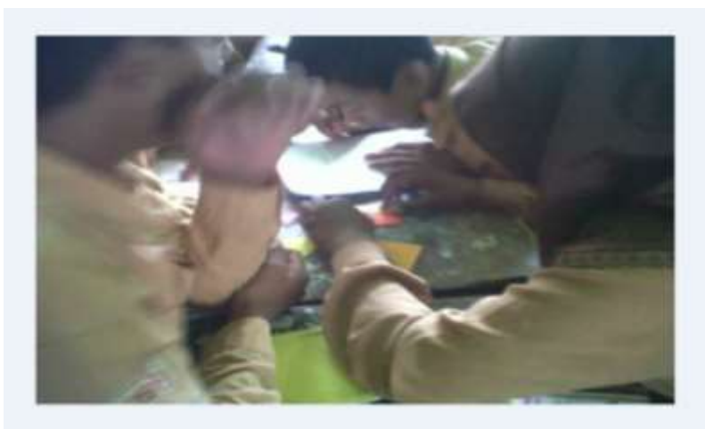
Gambar 3. Siswa Sedang Bekerjasama dalam Mengerjakan Soal

Gambar di atas ini menerangkan tentang proses pembelajaran kelompok dan siswa sedang mengerjakan soal latihan setelah menggunakan media tangram. Peran guru disini sebagai fasilitator untuk melayani setiap siswa yang bertanya karena kurang mengerti tentang penggunaan tangram dan perintah soal latihan.