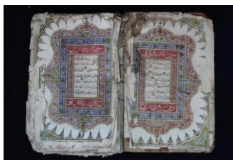
Gambar 3. Mushaf Syekh Muhammad Syaid Bonjol, Sumatera Barat

Pada fase berikutnya, setelah berakhirnya era litografi, lebih tepatnya pada awal abad ke-20, perkembangan mushaf Al-Qur'an di Indonesia jauh mengalami perubahan yang besar. Hal ini ditandai dengan penggunaan teknologi mesin cetak modern dalam penerbitan dan pencetakan mushaf Al-Qur'an. Sekitar tahun 1930-an, sudah ada tiga penerbit di Indonesia sebagai generasi awal yang mencetak mushaf melalui teknologi mesin cetak modern, yaitu penerbit di Matba'ah Islamiyah di Bukittinggi, penerbit Abdullah Afif di Cirebon, dan penerbit Salim Nabhan di Surabaya. 24 Sama seperti cetak litografi, teknologi mesin cetak modern tentu sangat memudahkan para penerbit untuk berkreasi dalam mencetak mushaf Al-Qur'an yang lebih modern dan bervariasi, termasuk dalam hal pewarnaan teks ayat dan iluminasi mushaf, serta sampul mushaf yang sudah modern dan berwarna.