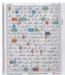
Gambar 5. Mushaf Lautan Lestari

Untuk contoh model mushaf ini, ada dua penerbit yang memprakarsai penerapan sistem tajwid warna dalam mushaf cetakannya, yaitu Lautan Lestari (Lestari Books) dan Yayasan Jayabaya, Jakarta. Mushaf yang dicetak dari kedua penerbit ini setidaknya menggunakan 7 warna untuk 7 kaidah tajwid. Penerbit Lautan Lestari menggunakan warna biru muda untuk ikhfa , merah muda untuk ikhfa syafawi , merah untuk qalqalah , biru untuk iqlab , hijau untuk idgam bigunnah , hijau muda untuk idgam syafawi (mimi) , dan jingga untuk gunnah . Adapun penerbit Yayasan Jayabaya menggunakan warna biru untuk ikhfa , merah muda untuk ikhfa syafawi , jingga untuk qalqalah , ungu untuk iqlab , hijau untuk idgam bigunnah , hijau muda untuk idgam syafawi (mimi) , merah untuk gunnah , dan abu-abu untuk idgam bilagunnah . Jika penerbit Lautan Lestari menggunakan pola pewarnaan blok pada ketujuh bacaan tajwid ini, sedangkan penerbit Yayasan Jayabaya menggunakan pola pewarnaan arsir horizontal. 27