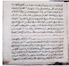
Gambar 2. Mushaf Pangeran Mas, Banten

menggunakan warna dasar seperti halnya mushaf-mushaf konvensional lainnya, yaitu ditulis dengan tinta hitam di atas kertas putih, jarang ada warna lainnya.