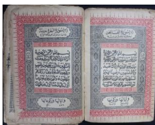
Gambar 4. Mushaf Cetakan Abdullah Afif, Cirebon

Pada fase berikutnya, setelah berakhirnya era litografi, lebih tepatnya pada awal abad ke-20, perkembangan mushaf Al-Qur'an di Indonesia jauh mengalami perubahan yang besar. Hal ini ditandai dengan penggunaan teknologi mesin cetak modern dalam penerbitan dan pencetakan mushaf Al-Qur'an. Sekitar tahun 1930-an, sudah ada tiga penerbit di Indonesia sebagai generasi awal yang mencetak mushaf melalui teknologi mesin cetak modern, yaitu penerbit di Matba'ah Islamiyah di Bukittinggi, penerbit Abdullah Afif di Cirebon, dan penerbit Salim Nabhan di Surabaya. 24 Sama seperti cetak litografi, teknologi mesin cetak modern tentu sangat memudahkan para penerbit untuk berkreasi dalam mencetak mushaf Al-Qur'an yang lebih modern dan bervariasi, termasuk dalam hal pewarnaan teks ayat dan iluminasi mushaf, serta sampul mushaf yang sudah modern dan berwarna.