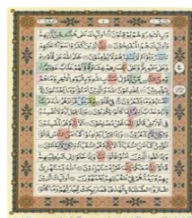
Gambar 6. Mushaf Jayabaya

Setelah kedua penerbit tersebut berhasil menerbitkan dan menampilkan mushaf Al-Qur'an model baru ke tengah-tengah masyarakat muslim Indonesia, ternyata mendapatkan animo dan antusias yang begitu besar dari konsumen. Terbukti mushaf tajwid warna ini laris manis banyak dibeli oleh masyarakat, khususnya kalangan perempuan, remaja, dan anak-anak. Seiring berjalannya waktu serta tingginya permintaan terhadap mushaf model ini membuat sejumlah penerbit lain juga ikut melirik untuk mencetak mushaf tajwid warna dengan menggunakan varian warna yang berbeda-beda. Sebut saja, di antaranya PT. Cahaya Intan Cemerlang Jakarta (2006), Maghfirah Pustaka Jakarta (2006), PT. Syaamil Cipta Media Bandung (2006), PT. Pena Pundi Aksara Jakarta (2007), PT. Karya Toha Putra Semarang (2008), PT. Suara Agung Jakarta (2008), CV. Jabal Raudhotul Jannah Bandung (2009), PT. Sygma Examedia Arkanleema Bandung (2009 dan 2010), serta penerbit Cahaya Qur'an Jakarta (2011). 28 Dari sekian banyak mushaf di atas, memperlihatkan bahwa variasi warna dalam mushaf-mushaf Al-Qur'an di Indonesia semakin banyak.