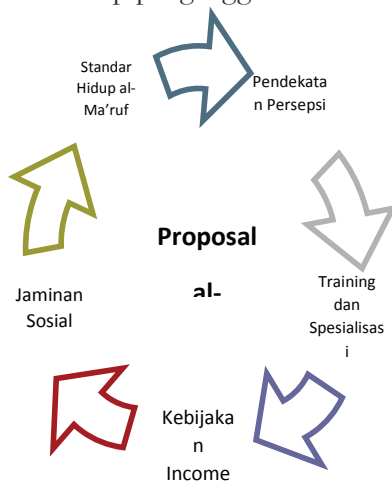
Gambar 3. Ilustrasi Proposal Kebijakan al-Shaybānī

Dengan demikian, gagasan al-Shaybānī dalam ranah teori kebijakan terhadap pengangguran, dapat dilihat sebagai kebijakan yang menggabungkan (konvergentif) beberapa instrumen dari tipologi-tipologi kebijakan modern terhadap pengangguran. Dalam tataran, fase pasca krisis perekonomian, inisiasi tersebut dapat dipandang sebagai kebijakan stabilisasi terhadap pengangguran.