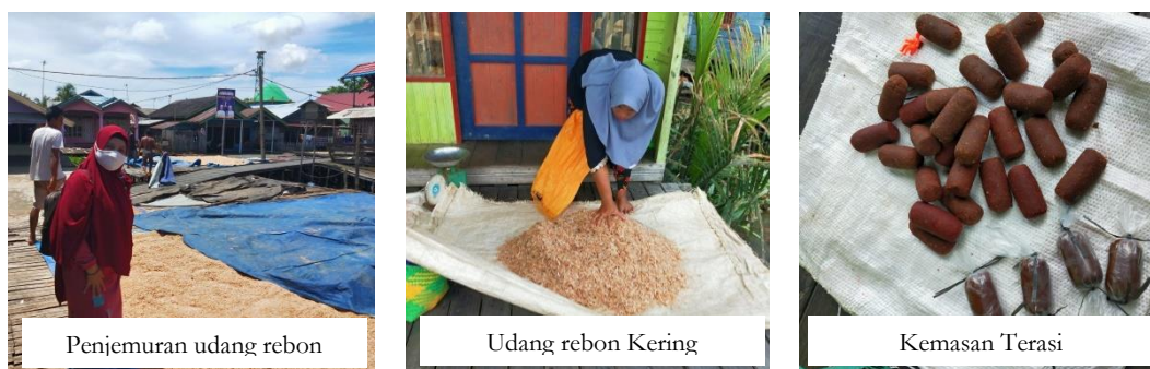
Gambar 2. Kegiatan Penjemuran Udang Rebon dan Hasil Peroduksi Terasi dari Usaha Rumah Tangga Olahan Udang Rebon (Terasi)

Produksi terasi yang dihasilkan masih berasal dari kegiatan tradisional tanpa menggunakan alat moderen dengan bentuk kemasan yang sederhana dari plastik tanpa label dan belum mendapat sertifikasi halal dari MUI serta belum terpenuhinya aspek higienis dari BPOM, sebagai contoh produksi terasi dapat dilihat pada Gambar 2 berikut ini.