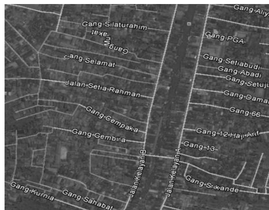
Gambar: Diolah Lokasi Responden Bertempat Tinggal, Google Map, 2013

Adapun tempat penelitian ini adalah Kelayan B, Banjarmasin Selatan, Kalimantan Selatan seperti sudah digambarkan panjang lebar dalam uraian di atas. Namun memang tidak keseluruhan wilayah Kelayan B yang menjadi lapangan penelitian, kami fokus pada Kelurahan Kelayan B Tengah yang sebelah Utara berbatasan dengan kelurahan Kelayan A Tengah, Kecamatan Kelayan A, sebelah Selatan berbatasan dengan Kelurahan K.S. Tubun, Kecamatan Rantauan Kecil Iir (Pekauman), sebelah Barat berbatasan dengan Kelurahan Kelayan B Barat, dan sebelah Timur berbatasan dengan Kelurahan Kelayan B Timur. Pemilihan Kelurahan Kelayan B Tengah ini sebagai obyek penelitian berdasarkan alasan karena ia bisa menjadi sampel keseluruhan wilayah Kelayan B bahkan dimungkinkan untuk wilayah Kelayan secara keseluruhan. Artinya, keadaan-keadaan atau masalah-masalah yang ada di keseluruhan wilayah Kelayan B ada di Kelurahan Kelayan B Tengah ini, atau dalam ungkapan lain bisa mewakili kelurahan-kelurahan lainnya yang terdapat di wilayah Kelayan B, termasuk Kelurahan B Barat dan Kelurahan B Timur.