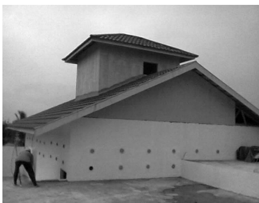
Gambar III.6: Diolah, Salah satu Pengasuh Majelis sedang Membersihkan Sarnag Burung Walet

Keadaan seseorang baik ataupun preman, kaya atau miskin termasuk sunatullah. Keadaan itu diciptakan Tuhan berdasarkan sebab-sebab tertentu, kaidah-kaidah yang bersifat tetap dan berlaku umum bagi manusia, berlaku bagi mereka yang beriman dan tidak beriman. Kemiskinan atau musibah yang melanda seseorang tidaklah berarti bahwa ia dibenci Tuhan. Manusia yang sabar dalam menghadapi kesulitan hidup akan dikasihi oleh Tuhan. Jadi, pemberdayaan yang dilakukan terhadap para komunitas preman Kelayan B adalah untuk menguatkan mental dan material mereka dari ketidak-berdayaan menghadapi kesulitan hidup.