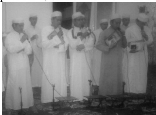
Gambar III.5: Diolah, Group Terbang Tampil dalam Acara Keagamaan 2013

Ketiga , pemberdayaan yang dilakukan adalah pelatihan menabuh genderang ( memukul tarbang ) untuk mengiring pembacaan syair maulid bagi laki-laki atau perempuan. Mereka ini sering dipanggil orang untuk acara-acara keagamaan, seperti acara maulidan bulan Rabiul Awal, acara isra' mi'raj bulan Rajab, acara hadrah penggiring acara perkawinan, dan lain-lain.