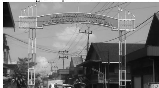
Gambar: Diolah Lokasi Responden Bertempat Tinggal, Foto, 2013

Adapun waktu penelitian ini dilaksanakan sekitar 7 bulan; yakni dimulai sejak pemetaan masalah dalam diskusi pada forum komunitas Ulama Kelayan B yang dilaksanakan pada tanggal 22 April 2013 di Majelis Pengajian Tuan Guru Qamaruddin, yang selanjutnya diikuti dengan aktivitas-aktivitas lainnya seperti preliminary research , pelaksanaan aksi di lapangan yang meliputi mengenal masyarakat setempat, penelusuran lapangan, bekerjasama dengan kelompok yang terbuka dan siap membantu serta kelompok lain yang seaspirasi hingga akhir kegiatan berupa membuat laporan akhir kegiatan pada bulan Oktober 2013.