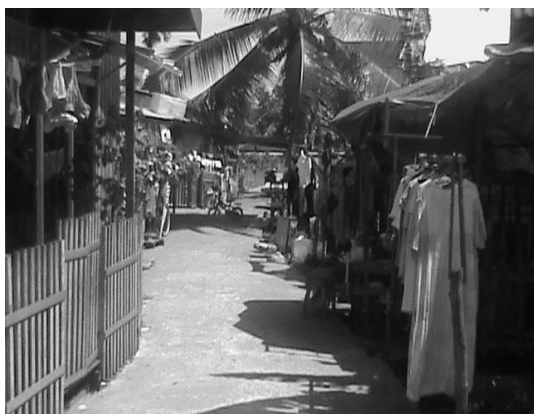
Gambar II.2 : Diolah, Salah satu kerawanan karena lingkungan yang kumuh

Ringkas kata dengan penyelesaian atau pengurangan masalah kriminalitas, maka masalah yang lainnya akan terselesaikan dan berkurang pula, meskipun memakan waktu yang cukup panjang dan melelahkan.