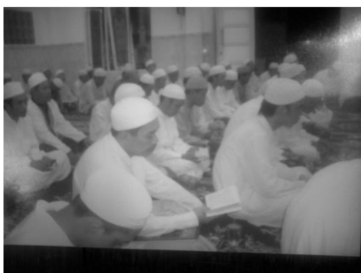
Gambar III.4: Diolah, Pengajian diselenggarakan di Majelis "Darul Madinah"

Seiring dengan itu ia ajarkan pula, ajaran kasih sayang dari Islam yang juga termasuk ajaran pokok dan prinsipil, karena Allah maha Rahman dan maha Rahim . Al-Rahman dan al-Rahim adalah kata benda dari wazan yang berlainan, yang menyatakan arti yang berdekatan. Al-Rahman berasal dari wazan fa'lan untuk menunjukkan jenis kasih sayang yang teramat besar, sedangkan al-Rahim berasal dari wazan fa'il untuk menyatakan kasih sayang tak putus-putusnya. Kita disuruh Nabi Muhammad Saw untuk memulai perbuatan yang baik dengan membaca basmalah yakni bismillahirrahmanirrahim , artinya dengan nama Allah yang maha Pengasih tak pilih kasih, maha Penyayang tak pandang sayang. Hal itu mengisyaratkan kita untuk mewarisi sifat rahman-rahim menjadi kepribadian kita sehari-hari, jauh dari rasa benci dan sikap keras serta ketidakramahan. Lebih dari itu, Nabi Muhammad Saw menegaskan man la yarham la