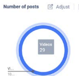
Gambar 2. Jumlah Post Akun Tiktok @perpusnas_ri