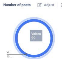
Gambar 2. Jumlah Post Akun Tiktok @perpusnas_ri