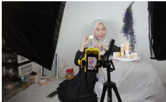
Gambar 4. Proses Pembuatan Konten Video

Sama halnya dengan informan YD, KL dan SO juga mengungkapkan hal yang sama. Keduanya juga menyatakan bahwa tahapan terakhir yang dilakukan adalah dengan menyajikan informasi dalam bentuk konten video. Adapun proses penyajian informasi tersebut dilakukan dengan sudah melalui beberapa rangkaian kegiatan, yang meliputi pengambilan video dan editing video. Untuk kemudian proses selanjutnya diunggah diberbagai platform media sosial yang berpeluang besar seperti instagram dan Tik Tok. Kegiatan ini merupakan tahapan terakhir dalam aktivitas pencarian informasi yang dikemukakan dalam teori David Ellis.