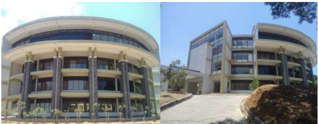
Gambar 1 Gedung Perpustakaan Pusat Kandaga UNPAD

Selain itu juga hal lainnya adalah kesiapan lembaga perpustakaan dalam mendukung proses pembelajaran secara daring. Untuk membahas tentang kesiapan perpustakaan pusat Kandaga UNPAD dalam mendukung proses pembelajaran secara daring (online learning) ada baiknya dikemukakan terlebih dahulu mengenai gambaran tentang perpustakaan pusat kandaga Universitas Padjadjaran. Perpustakaan pusat Universitas Padjadjaran atau yang lebih dikenal dengan perpustakaan pusat Kandaga UNPAD terletak di Jl. Raya Bandung Sumedang KM 21 Jatinangor. Perpustakaan ini disebut perpustakaan kandaga karena gedungnya menempati Gedung menempati Gedung Graha Kandaga. Sebelum terjadinya pandemic covid-19 jam operasional Perpustakaan pusat Kandaga UNPAD buka setiap hari senin sampai dengan hari jumat, dengan jam buka dari pukul 08.00 s.d. 16.00 WIB dan waktu istirahat dari pukul 12.00 s.d. 13.00 WIB.