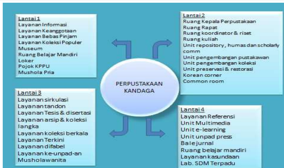
Gambar 5 Fasilitas Perpustakaan Pusat Graha Kandaga

Mengenai aspek fasilitas perpustakaan pusat Kandaga UNPAD dalam mendukung proses pembelajaran daring (online learning) tersedia layanan reference atau scholarly communication yang berbasis online baik melalui website maupun melalui layanan whatsapps. Melalui layanan ini para sivitas akademika baik dosen, mahasiswa maupun tenaga pendidik dapat mencari informasi yang dibutuhkannya melalui website perpustakaan kandaga unpad atau melalui layanan whatsapps untuk meminta bantuan informasi yang dibutuhkan pengguna. Dengan adanya dukungan jaringan internet yang sangat besar sangat memungkinkan pengguna maupun petugas perpustakaan pusat kandaga memberika layanan yang cepat. Jadi dilihat dari aspek fasilitas layanan yang berbasis online seperti website, dukungan jaringan internet serta optimalisais layanan yang berbasis media sosial dapat dikatakan dari sisi kesiapan aspek fasilitas, perpustakaan pusat kandaga UNPAD serta perpustakaan-perpustakaan fakultas yang ada dilingkungan UNPAD sudah siap dalam mendukung proses pembelajaran daring (online learning) yang dilakukan Universitas Padjadjaran.