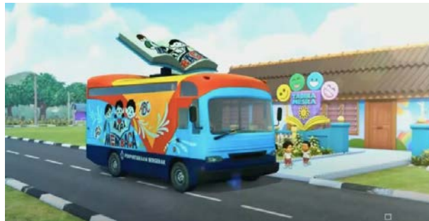
Gambar 1 Adegan pertama

Penggambaran perpustakaan keliling dan pustakawan dalam serial animasi upin ipin aku sebuah buku awal cerita serial animasi upin dan ipin aku sebuah buku bermula dari perpustakaan keliling. Lokasi mobil perpustakaan keliling terletak di pinggir jalan depan taman kanak-kanak tadika mesra. Kemudian cerita aku sebuah buku mengambil setting di dalam gedung perpustakaan.