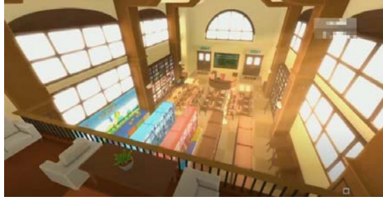
Gambar 4 Adegan keempat

Setelah membaca buku bersama, Upin dan Ipin berimajinasi mejadi sebuah buku yang berada di kotak besar berwarna coklat dan baru tiba di perpustakaan. Teknik pengambilan gambar adegan keempat ini adalah Full Shoot. Hal ini bertujuan untuk menggambarkan keadaan di dalam gedung perpustakaan yang memiliki bangunan luas dan bersih serta mempunyai warna dominan coklat dengan perabot yang terbuat dari kayu. Perpustakaan ini bernama perpustakaan ilmu dan memiliki 2 lantai. Lantai yang pertama terdapat rak koleksi, kursi dan meja baca, dan meja sirkulasi. Perpustakaan didesain menggunakan warna coklat. Mulai dari rak koleksi buku yang berjejer rapi, kursi dan meja yang tertata rapi, meja sirkulasi yang bersih dan pintu perpustakaan. Di samping meja sirkulasi terdapat rak yang berwarna coklat sebagai tempat tanaman hias. Sedangkan di lantai 2 hanya terdapat meja baca yang digunakan untuk membaca mandiri.