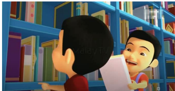
Gambar 6 Adegan keenam

Pada gambar adegan kedua menggunakan teknik Close Up yang menunjukkan pustakawan sedang menata buku di rak koleksi. Pada gambar tersebut, koleksi buku-buku yang diletakkan di rak terlihat tidak memiliki call number pada punggung koleksi. Makna konotasi pada gambar adegan tersebut adalah kondisi perpustakaan yang digambarkan masih belum menerapkan call number pada punggung buku. Kondisi ini juga terjadi di beberapa perpustakaan daerah yang masih belum menerapkan kegiatan (klasifikasi atau katalogisasi) pada setiap koleksi yang dimiliki, tetapi sudah di display pada rak koleksi. Pada sisi lain, koleksi yang dimiliki juga terbatas pada koleksi cetak seperti buku, dan belum memiliki koleksi elektronik.