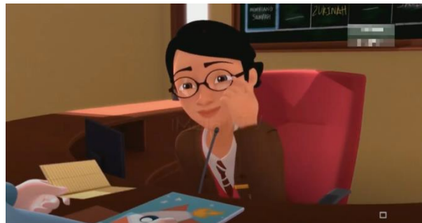
Gambar 7 Adegan ketujuh

warna merah serta biru. Keadaan ini merepresentasikan bahwa perpustakaan tersebut merupakan jenis perpustakaan umum yang memiliki pengunjung mulai dari anak-anak, remaja hingga orang dewasa. Warna rak koleksi yang berbeda menunjukkan perbedaan jenis koleksi. Warna rak coklat ditujukan untuk koleksi remaja atau orang dewasa, sedangkan untuk warna rak biru dan merah ditujukan untuk koleksi anak-anak. Perbedaan warna rak koleksi ini digunakan agar pengunjung yang datang tidak mengalami kesulitan saat mencari koleksi yang dibutuhkan.