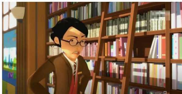
Gambar 5 Adegan kelima

Penggunaan warna coklat secara umum mampu menghadirkan kesan alami, tetapi juga klasik (antik). Sedangkan secara psikologis mengesankan kenyamanan. Dalam gambar adegan tersebut, perpustakaan direpresentasikan sebagai gedung yang sudah tua. Tetapi, secara psikologis penggunaan warna coklat digunakan oleh perpustakaan agar pengunjung bisa merasa tenang dan nyaman untuk menghabiskan waktu yang lama di dalam perpustakaan. Setting tempat ini menggunakan suasana perpustakaan yang tidak tersentuh dengan teknologi, sedangkan kenyataannya serial animasi ini di produksi pada Desember 2018 yang mana perkembangan perpustakaan di Malaysia tergolong pesat. Hal ini tidak sejalan dengan perpustakaan yang digambarkan dalam serial animasi ini yang masih mempertahankan hal-hal yang bersifat konvensional seperti tidak adanya teknologi dalam perpustakaan ini.