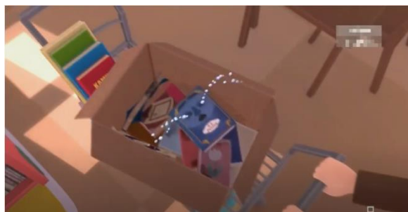
Gambar 9 Adegan kesembilan

Teknik pengambilan kedua gambar tersebut menggunakan teknik close up yang bertujuan untuk memperlihatkan kerusakan yang terjadi pada koleksi buku di perpustakaan. Kedua gambar adegan tersebut menunjukkan bahwa koleksi di perpustakaan sering mengalami kerusakan yang diakibatkan oleh pengguna. Berbagai jenis kerusakan terjadi pada koleksi buku mulai dari merobek koleksi, mencoret, atau memberikan noda makanan pada koleksi buku yang tersedia. Keadaan ini merepresentasikan bagaimana kondisi koleksi perpustakaan yang masih terjadi sampai saat ini, dimana sering terjadi vandalisme atau kerusakan terhadap bahan koleksi yang dilakukan oleh pengguna. Makna konotasi yang ada pada kedua gambar ini adalah pengguna tidak bisa menjaga koleksi yang ada di perpustakaan dengan baik. Hal ini terlihat dari aturan yang tidak ditaati oleh pengguna sehingga menyebabkan koleksi buku menjadi kotor dan rusak.