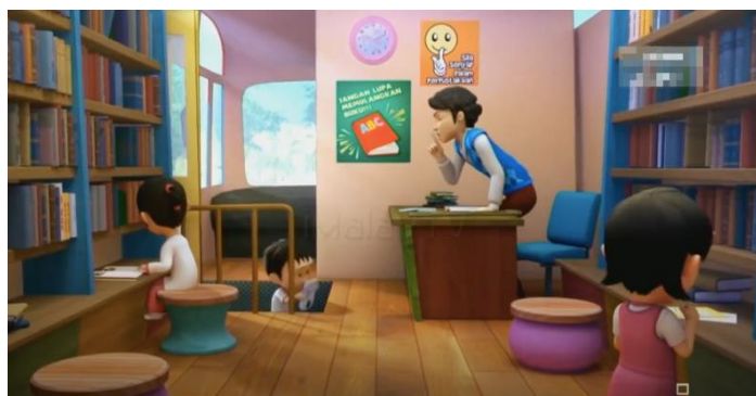
Gambar 2 Adegan kedua

Dalam adegan ini menggambarkan bahwa anak-anak diajarkan untuk menumbuhkan minat baca sedari kecil dengan cara membiasakan diri untuk datang ke perpustakaan. Representasi adegan ini adalah dengan menerapkan budaya antri kepada anak-anak saat akan memasuki mobil perpustakaan keliling. Dalam gambar tersebut juga menunjukkan upaya sosialisasi kepada masyarakat untuk mengajarkan kepada anak-anak agar gemar membaca sedini mungkin dengan cara rajin mengunjungi perpustakaan. Karena dengan membaca, maka akan mendapatkan berbagai macam informasi.