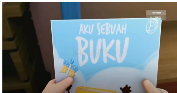
Gambar 3 Adegan ketiga

Representasi mobil keliling menunjukkan adanya berbagai macam warna yang digunakan pada setiap furnitur agar anak-anak senang ketika berada di mobil perpustakaan keliling dan semangat untuk membaca buku yang telah disediakan. Sedangkan isi himbauan pada poster pertama menunjukkan bahwa anak-anak dibiasakan untuk lebih disiplin dalam mengembalikan buku yang telah dipinjam tepat waktu, sehingga tidak terkena denda pengembalian buku. Dalam poster kedua menunjukkan bahwa anak-anak mulai dikenalkan pada aturan untuk tidak boleh membuat suara-suara yang bisa mengganggu orang lain saat sedang berada di dalam perpustakaan. Perpustakaan keliling tersebut juga menerapkan sistem open access sehingga pengunjung langsung datang ke rak koleksi untuk mencari koleksi buku yang diinginkan.