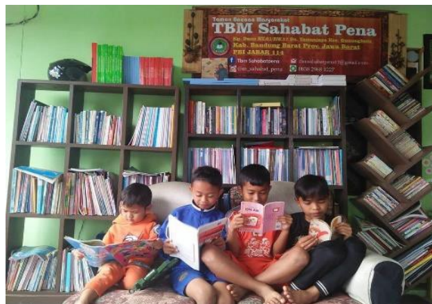
Gambar 1 : Koleksi Taman Bacaan Masyarakat

Pengertian buku jika merujuk pada batasan UNESCO adalah merupakan bahan pustaka yang merupakan suatu kesatuan utuh yang memiliki halaman paling sedikit 49 halaman tidak termasuk kulit maupun jaket buku. Adapun mengenai jenis buku yaitu 1) buku-buku teks ( Textbooks ); 2) buku-buku referensi ( Reference Books ); 3) buku-buku bacaan ( Supplementary readings ).