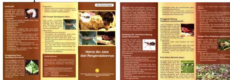
Gambar 3 brosur Hama Ubi Jalar dan Pengendaliannya

Proses eksternalisasi melalui dokumentasi pengetahuan ke dalam brosur, leaflet, dan infografis menunjukkan peran aktif pustakawan dalam mengonversi tacit ke eksplisit. Uniknya, proses ini bersifat partisipatif dan dialogis, tidak semata-mata top-down dari ahli ke masyarakat. Momen ketika petani Desa Benteng membaca brosur dan "merasa pintar" karena menemukan informasi tentang jenis hama ulet yang tidak dijelaskan penyuluh menunjukkan bahwa pengetahuan eksplisit yang telah didokumentasikan dapat memberdayakan petani untuk belajar mandiri. Hal ini memperkuat argumen Nurislaminingsih dkk. (2020) bahwa pustakawan referensi bertugas mengubah informasi menjadi pengetahuan baru bagi pemustaka, yang pada hakikatnya merupakan proses konversi pengetahuan dari bentuk eksplisit (bahan pustaka) menjadi pengetahuan yang dapat diaplikasikan secara praktis. Dokumentasi yang baik juga memungkinkan pengetahuan terdistribusi lebih luas dan bertahan lebih lama dalam ingatan pengguna dan tidak bergantung pada kehadiran fisik ahli atau penyuluh. Berikut adalah contoh brosur yang diambil dari repositori kementerian pertanian, dalam brosur tersebut sudah memuat informasi singkat tentang hama ubi jalar dan cara pengendaliannya yang disusun dalam kombinasi teks singkat, gambar, dan poin-poin penting, brosur tersebut juga mencantumkan sumber informasi yang jelas baik berasal dari jurnal maupun buku.