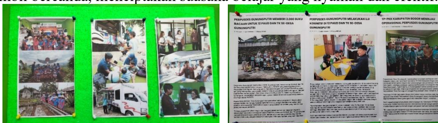
Gambar 1 Dokumentasi kegiatan di Perpustakaan Desa Gunungputri

Proses sosialisasi dalam program Pustaka Bergerak (PUBER) terjadi secara intensif melalui praktik langsung dan kedekatan personal. Temuan ini memperkuat penelitian Winastwan dkk. (2025) yang menemukan bahwa sosialisasi dalam pemberdayaan relawan terjadi melalui diskusi kelompok dan kegiatan kolaboratif. Namun, penelitian ini menunjukkan bahwa dalam konteks petani, sosialisasi membutuhkan pendekatan yang lebih kontekstual dan akrab dengan budaya lokal. Praktik langsung di sawah dan kebun, serta kegiatan informal seperti "ngeliwet" (makan bersama) telah menciptakan ruang aman bagi pertukaran pengetahuan tacit yang mungkin tidak terjadi dalam suasana formal. Kedekatan personal yang dibangun tim lapangan yang disebutkan oleh Nana dengan kunjungan di luar jam kerja dan penggunaan dana pribadi untuk melengkapi fasilitas perpustakaan desa menciptakan rasa saling percaya ( trust ) yang menurut Issa dan Haddad (2008) merupakan faktor pendorong utama dalam berbagi pengetahuan. Hasil pengamatan peneliti di lokasi KWT Mitra Harapan Tanah Sareal menunjukkan bagaimana Adi sebagai penyuluh berinteraksi akrab dengan ibu-ibu Kelompok Wanita Tani (KWT), menjelaskan teknik penyemaian sambil bercanda, menciptakan suasana belajar yang nyaman dan efektif.