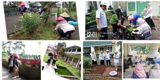
Gambar 2 Dokumentasi kegiatan Ibu-Ibu Kelompok Wanita Tani (KWT) Mitra Harapan Tanah Sareal

Proses eksternalisasi melalui dokumentasi pengetahuan ke dalam brosur, leaflet, dan infografis menunjukkan peran aktif pustakawan dalam mengonversi tacit ke eksplisit. Uniknya, proses ini bersifat partisipatif dan dialogis, tidak semata-mata top-down dari ahli ke masyarakat. Momen ketika petani Desa Benteng membaca brosur dan "merasa pintar" karena menemukan informasi tentang jenis hama ulet yang tidak dijelaskan penyuluh menunjukkan bahwa pengetahuan eksplisit yang telah didokumentasikan dapat memberdayakan petani untuk belajar mandiri. Hal ini memperkuat argumen Nurislaminingsih dkk. (2020) bahwa pustakawan referensi bertugas mengubah informasi menjadi pengetahuan baru bagi pemustaka, yang pada hakikatnya merupakan proses konversi pengetahuan dari bentuk eksplisit (bahan pustaka) menjadi pengetahuan yang dapat diaplikasikan secara praktis. Dokumentasi yang baik juga memungkinkan pengetahuan terdistribusi lebih luas dan bertahan lebih lama dalam ingatan pengguna dan tidak bergantung pada kehadiran fisik ahli atau penyuluh. Berikut adalah contoh brosur yang diambil dari repositori kementerian pertanian, dalam brosur tersebut sudah memuat informasi singkat tentang hama ubi jalar dan cara pengendaliannya yang disusun dalam kombinasi teks singkat, gambar, dan poin-poin penting, brosur tersebut juga mencantumkan sumber informasi yang jelas baik berasal dari jurnal maupun buku.