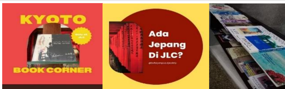
Gambar 1. Kyoto Book Corner dan Koleksi Majalah Koreana