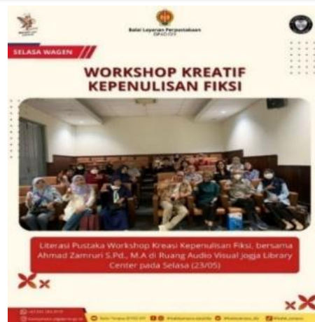
Gambar 3. Workshop Kreatif Kepenulisan Fiksi

Sumber bahan bacaan yang disediakan oleh Balai Layanan Perpustakaan DPAD DIY merupakan bentuk dari usaha menyediakan pengetahuan untuk diserap oleh masyarakat melalui bacaan, tidak sampai disitu saja Balai Layanan Perpustakaan DPAD DIY juga memberikan pelatihan berupa pelatihan secara langsung kepada masyarakat yang diharapkan mampu membangun pola pikir masyarakat sehingga mampu membangun intelektualnya. Konsep yang tidak kalah pentingnya yaitu mendorong masing-masing pribadi masyarakat untuk menyadari kelebihan dan konsep diri yang bagus sehingga nantinya kemampuan ini mampu menunjang kehidupan masyarakat yang jauh lebih baik lagi.