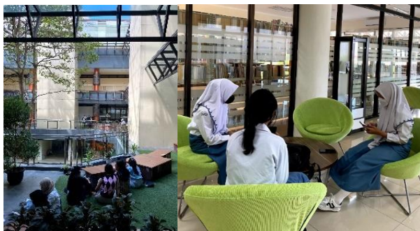
Gambar 4. Pemustaka Memanfaatkan Ruang Publik Balai Layanan Perpustakaan DPAD DIY

Transformasi pada perpustakaan terjadi mengikuti kebutuhan masyarakat informasi. Jika dahulu pemustaka datang ke perpustakaan hanya untuk membaca dan meminjam serta mengembalikan bahan pustaka, kini bertransformasi, pemustaka bisa datang ke perpustakaan memanfaatkan akses ruang publik yang disediakan. Akses ruang publik indoor dan outdoor seperti gazebo, ruang diskusi, area outdoor dan ruang free function yang disediakan oleh Balai Layanan Perpustakaan DPAD DIY bisa dimanfaatkan untuk sarana bertukar pikiran, berbincang dengan teman, berdiskusi dan lain sebagainya. Akses ini bukti bahwa perpustakaan mampu menciptakan ruang yang di mana ada kebebasan dan kesetaraan di dalamnya.