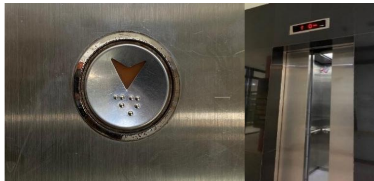
Gambar 2. Lift Dilengkapi Tombol Huruf Braille

Akses untuk penyandang difabel sudah mulai diperhatikan mulai dari penyediaan alat bantu bagi penyandang difabel seperti tongkat, kursi roda dan lain sebagainya, penyediaan lift dengan tombol huruf braille, dan kamar mandi khusus difabel, Ramp (jalur khusus kursi roda), parkir serta koleksi buku braille. Tetapi untuk penyandang difabel layanan yang masih kurang adalah guiding block lantai khusus penyandang tuna netra ini belum tersedia. Berdasarkan pernyataan informan Zili: