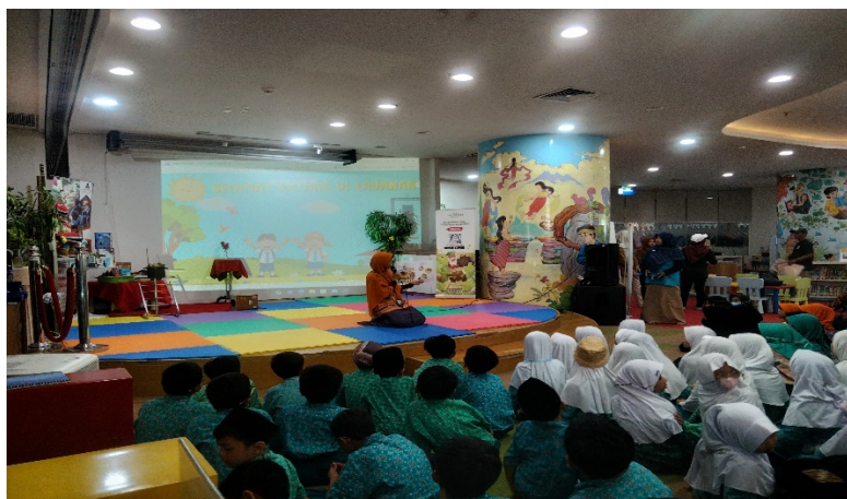
Gambar 1. Pustakawan yang sedang melakukan program Read Aloud kepada anak-anak

Keberhasilan layanan perpustakaan, khususnya peningkatan minat baca, bergantung pada banyak faktor. Salah satunya adalah petugas perpustakaan atau pustakawan yang memberikan program di layanan. Pustakawan diharapkan dapat melaksanakan tugasnya secara profesional, berdasarkan keterampilan, wawasan, pengetahuan, dan sikap yang sesuai. Pustakawan harus berupaya semaksimal mungkin untuk meningkatkan minat membaca anak-anak. Pustakawan perlu benar-benar memahami prinsip-prinsip membaca, ciri-ciri membaca yang baik, persiapan, dan cara memotivasi siswa agar gemar membaca (Agustina Kurniyati, 2021).