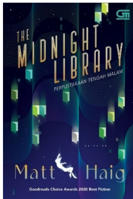
Gambar 2 Cover depan novel “ The Midnight Library: Perpustakaan Tengah Malam ”

Berdasarkan sekian banyak buku yang sudah dikaji dan dijadikan sebagai topik diskusi pada akun Literary Base, peneliti memilih novel “ The Midnight Library: Perpustakaan Tengah Malam ” karya Matt Haig tahun 2020 yang telah diterjemahkan dalam Bahasa Indonesia oleh Dharmawati serta diterbitkan Gramedia Pustaka Utama. Hingga September 2023, versi asli novel tersebut sudah terjual sebanyak 9 juta copy di 54 negara (Haig, 2023).