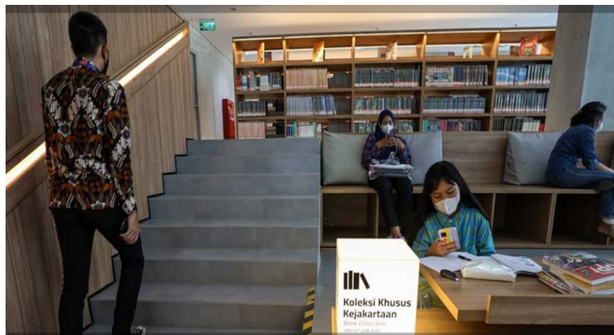
Gambar 6 Ruang Baca Bernuansa Terbuka Minimalis