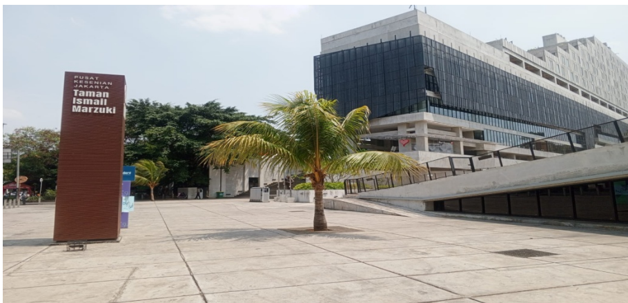
Gambar 1 Bangunan Perpustakaan, Tampak Depan

Bangunan Perpustakaan Jakarta terbagi menjadi tiga bagian utama: Perpustakaan Jakarta yang berada di bagian depan bangunan, Pusat Dokumen Sastra Hans Bague Jassin yang terletak di lantai 4 bagian belakang, serta Galeri Emiria Soenassa dan Galeri Sindoadarsono Soedjojono yang menempati lantai 1 dan 2 di bagian belakang bangunan Perpustakaan Jakarta. Desain bangunannya menampilkan gedung panjang dengan jendela-jendela berundak dari lantai 9 hingga 14, serta halaman depan yang dilengkapi aksesoris pohon kelapa yang dirancang menyerupai not balok lagu "Rayuan Pulau Kelapa" karya Ismail Marzuki, seperti terlihat pada Gambar 2.1. di bawah ini.