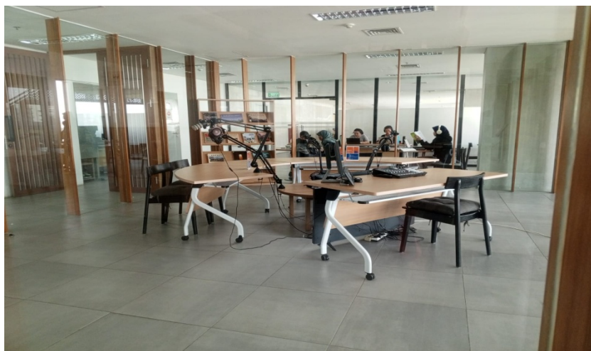
Gambar 11 Bilik Siniar (Podcast)

Perpustakaan ini didominasi oleh warna kayu dan beton yang hangat, terdiri dari tiga lantai yang mampu menampung lebih dari 130.000 koleksi buku dari berbagai genre dan arsip, serta menyediakan berbagai fasilitas dan area umum. Ada tangga yang menjulang ke lantai enam, yang telah menjadi favorit pengunjung untuk berfoto, terintegrasi dengan meja baca dan rak-rak yang menampilkan koleksi khusus, mulai dari buku-buku tentang Jakarta hingga karya seni, sastra, dan budaya yang dikurasi. Setiap lantai menawarkan ruang untuk pertemuan dan aktivitas.