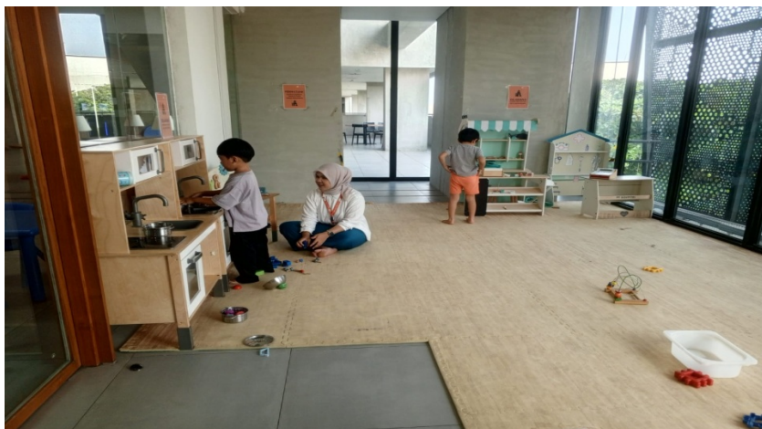
Gambar 9 Bilik Bermain Anak