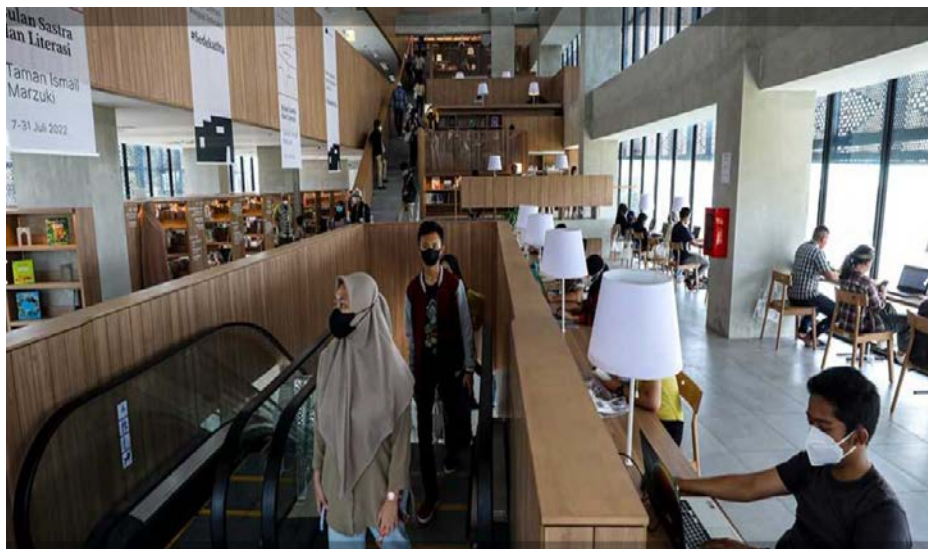
Gambar 3 Area Sirkulasi Koleksi