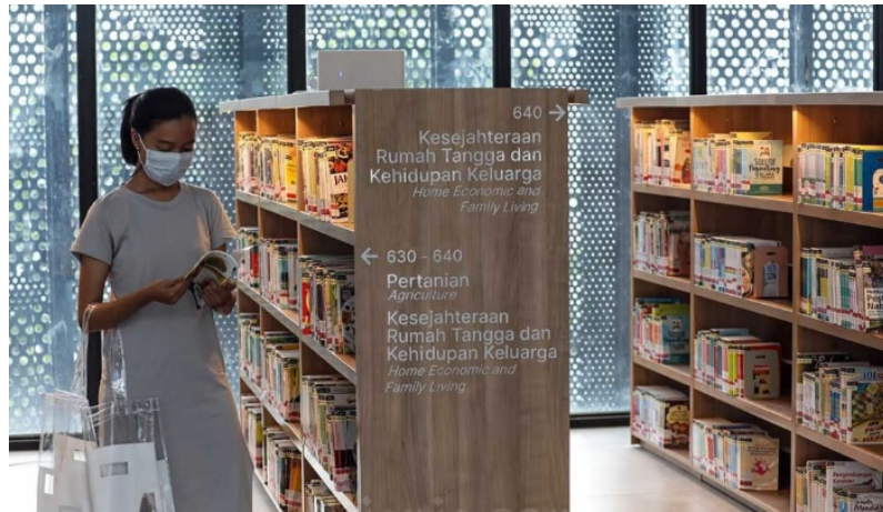
Gambar 4 Area Sirkulasi Koleksi