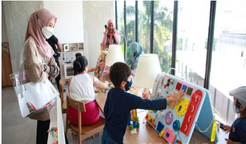
Gambar 10 Bilik Bermain Anak