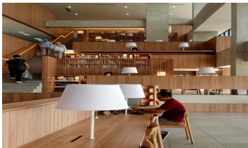
Gambar 5 Ruang Baca Bernuansa Terbuka Minimalis