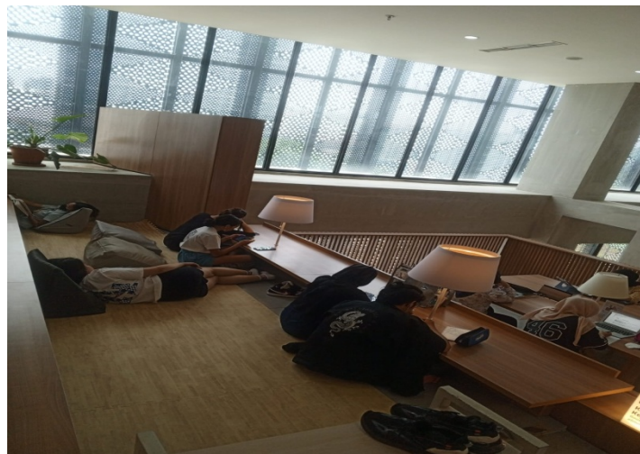
Gambar 8 Ruang Baca Bernuansa Terbuka Minimalis