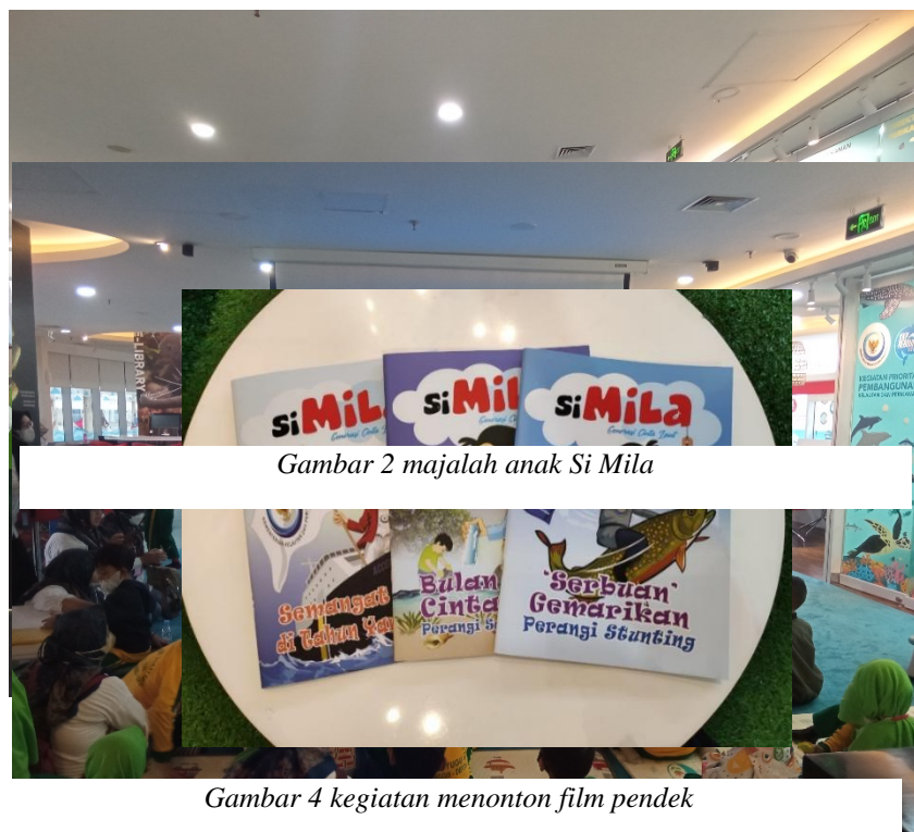
Gambar 2 majalah anak Si Mila

Adapun kegiatan menonton film pendek dilakukan dengan menonton film dalam bentuk animasi berjudul “ A Tale of Whale ” tentang dampak negatif membuang sampah ke laut. Kemudian untuk kegiatan mendongeng pustakawan mengundang seorang pendongeng Sarang Cerita yang membawakan dongeng dengan tema Cinta Laut, dilengkapi dengan kelengkapan mendongeng seperti alat peraga untuk membuat anak betah menyimak. Kegiatan kompetisi mewarnai juga menjadi bagian dari program penguatan literasi ini. Pustakawan menjadikan kegiatan mewarnai sebagai media untuk anak berimajinasi dan bereksplorasi. Dalam konsep teori literasi emergen, kegiatan literasi bagi anak dilakukan dengan memberi kesempatan untuk anak menyampaikan cerita, menulis ide/ gagasan yang ada di pikirannya, hingga melakukan permainan bermain peran untuk menstimulasi keterampilan membaca permulaan.