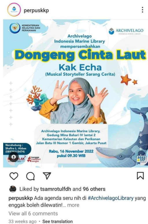
Gambar 4 konten media sosial tentang program penguatan literasi

Keempat, memanfaatkan media sosial untuk mempromosikan program penguatan literasi ini kepada masyarakat. Adapun jenis media sosial yang digunakan diantaranya Instagram, Twitter, LinkedIn, dan Whatsapp. Informasi terkait program ini disajikan dalam tampilan yang sangat menarik, tertata, dan bahasanya mudah dipahami. Meskipun anak-anak belum bermain media sosial, tetapi ada para orang tua yang bisa menerima informasi terkait program ini dan menyampaikannya kepada anak mereka. Pustakawan mendapatkan respon yang sangat baik di