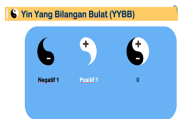
Gambar 1. Contoh guru

disatukan akan memiliki nilai normal (Gambar 1). Ketika siswa diberikan penjelasan tersebut, guru menemukan berbagai kreativitas siswa yang dapat dilihat pada Gambar 2. Terlihat dari gambar tersebut, siswa memahami makna media yang akan digunakan sehingga mereka dapat mengaplikasikan pembuatan media tersebut kedalam bentuk lainnya. Namun, masih juga terdapat 30% siswa yang melakukan pembuatan media seperti contoh yang ada, dan 10% lainnya melakukan pembuatan media yang tidak sesuai dengan cara kerja yang telah dijelaskan sebelumnya (Gambar 3). Kreativitas siswa tersebut muncul dipengaruhi oleh pembelajaran yang dilakukan (Hu et al, 2013: 4).