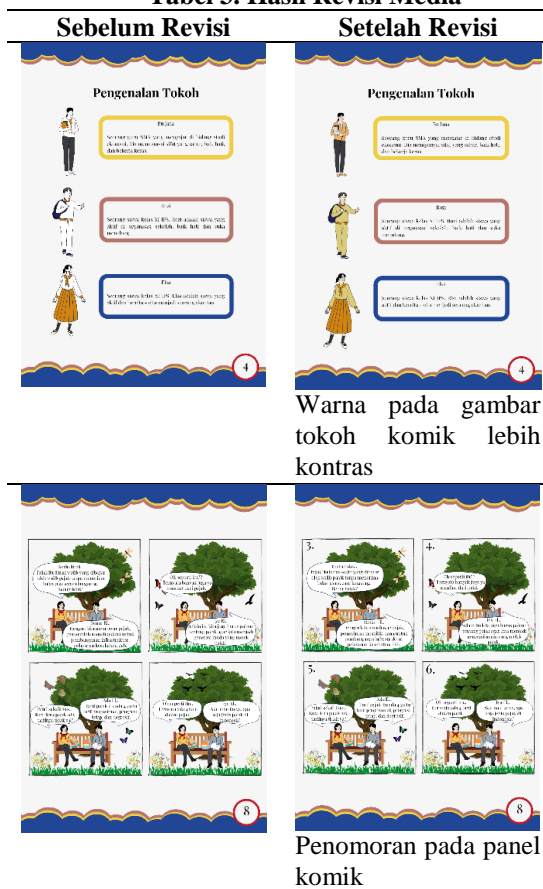
Tabel 3. Hasil Revisi Media

kepraktisan, efektivitas, dan evaluasi dari jurusan Pendidikan Ekonomi. Penilaian validasi pada media dilakukan untuk menguji tingkat kelayakan media yang dibuat sebelum dilakukan uji coba produk terbatas kepada peserta didik. Setelah proses telaah oleh ahli, peneliti melakukan penyempurnaan pada E-LKPD berbasis komik berlandaskan komentar dan saran validator. Berikut perbaikan yang dilakukan pada media: