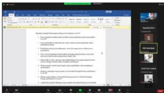
Gambar 1. Penyampaian materi pelatihan

Setelah kegiatan pelatihan, dilanjutkan kegiatan pendampingan dari mengidentifikasi masalah yang akan digunakan untuk PTK, menyusun proposal dan instrumen PTK, melaksanakan PTK, menulis laporan PTK, dan menulis artikel ilmiah. Pada kegiatan pendampingan identifikasi masalah, guru sudah proaktif menyampaikan permasalahan terkait