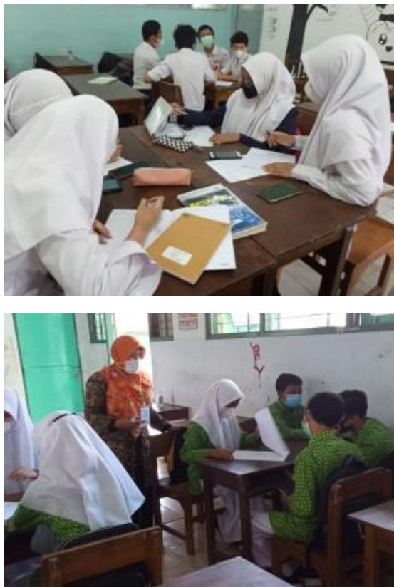
Gambar 2. Kegiatan pembelajaran saat PTK kelas offline

Pada gambar 2 beriku ini beberapa dokumentasi kegiatan pembelajaran dari pelaksanaan PTK