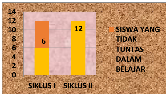
Grafik C.2. perbandingan ketuntasan belajar siswa secara individual siklus I dan II

Penjabaran dari tabel hasil evaluasi akhir pada siklus I dan II kemudian dibuat ke dalam grafik ketuntasan belajar siswa secara individual dan grafik ketuntasan belajar siswa secara klasikal sebagai berikut: