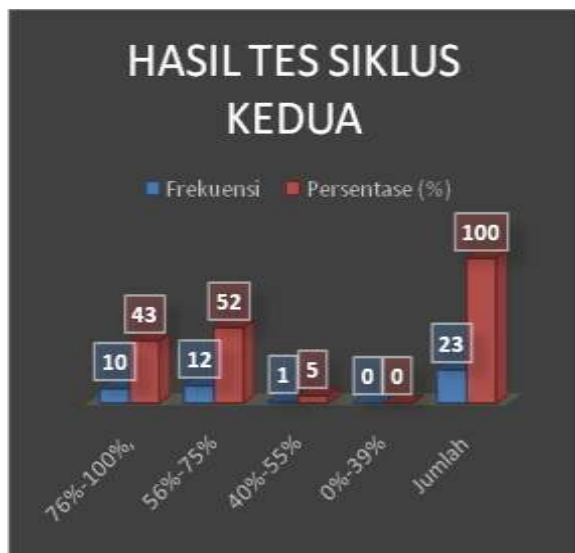
Grafik 3 Hasil Tes Siklus 2 Pertemuan Pertama