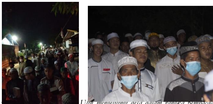
Gambar 1. Penghormatan pada Tangga Ulin mengunjungi desa dalam rangka pembacaan Burdah keliling pada masa Pandemi Covid-19.

Dari pengamatan dokumentasi yang ada serta wawancara, proses Burdah keliling dimulai setelah mereka menyelesaikan sholat maghrib berjamaah lalu dilanjutkan sholat Sunnah Hajat dan dilanjutkan lagi dengan shalat Isya yang dilakukan berjamaah di masjid. Kemudian, dipimpin oleh Ustadz atau Kyai, mereka berjalan sambil melantunkan sholawat Burdah sambil membawa penguat suara dan membawa botol air minum putih. Berawal dari masjid, Ustadz atau Kyai didepan mereka membaca sholawat Burdah secara bersama-sama. Sebagian besar peserta Burdah keliling adalah laki-laki muda dan ada yang masih anak-anak tetapi bapak-bapak pun juga ada. Disana tidak ada gadis yang terlihat. Sambil berjalan mereka melantunkan paduan suara “Maula ya Sholli wa salim da iman abada..” Hanya sang pemimpin yang membaca bait-bait panjang sholawat Burdah. Mereka berjalan dan kembali ke masjid. Pemimpin (Ustadz) akan membaca sholawat Burdah lebih lengkap dari awal sampai akhir dan sampai berdoa.