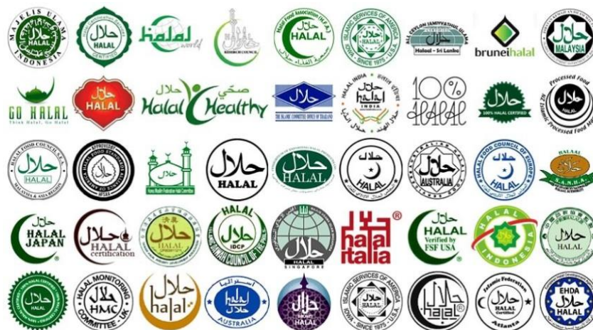
Gambar 3. Logo halal di dunia

Gambar di atas merupakan logo halal resmi di Indonesia yang dikeluarkan oleh Majelis Ulama Indonesia (MUI) dan beberapa kali terjadi perubahan dari logo halal itu sendiri sebagai kebijakan baru dari (MUI). Selanjutnya ialah beberapa logo halal resmi di beberapa negara.