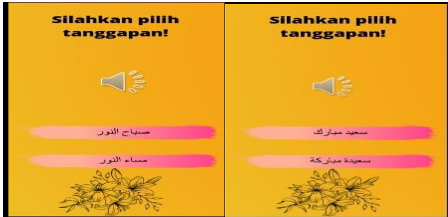
الصورة 1. اختيار الطلاب الإجابة الموافقة بالصوت المقدمة