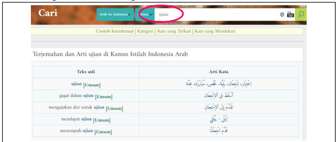
(Gambar 1.1) (Kamus al Maany)