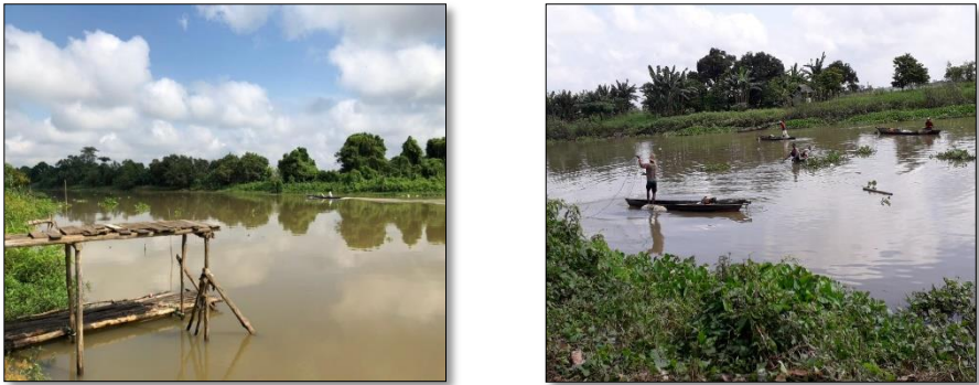
Gambar 2. Kondisi Sungai Rangas

maka akan mengalami gangguan dari makhluk gaib jelmaan buaya tersebut. Mereka akan mengalami kerasukan oleh makhluk gaib, sehingga tingkah lakunya seperti seekor buaya.