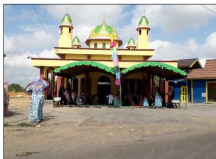
Gambar 1. Aktivitas Keagamaan di Kelurahan Sungai Rangas Ulu