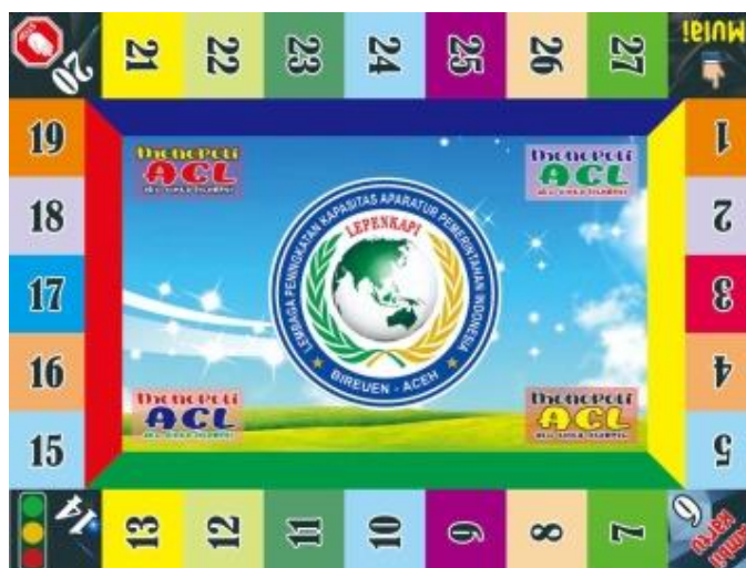
Gambar 2. Tikar Monopoli

Tikar Monopoli merupakan salah satu jenis Alat Permainan Edukatif (APE) yang digunakan oleh guru Pendidikan Anak Usia di Kabupaten Bireuen. Tujuan dari penggunaan APE untuk menciptakan pembelajaran yang menarik dan menyenangkan bagi anak usia dini. Selain itu penggunaan APE dapat memperjelaskan materi menghitung angka sederhana dari angka 1 sampai dengan 27 sesuai dengan desain di Tikar Monopoli.