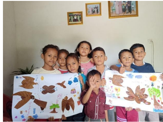
Gambar 3. Anak dan Hasil Karyanya Kolase Daun Kering

Dari gambar tersebut anak dibagi menjadi dua regu yang mana masing masing regu bekerja sama membuat karya dan bekreativitas sesuai dengan ide masing-masing anak. Regu A membuat burung merak dan lebah dengan begitu cantik disertai pemandangan alam yang asri. Sedangkan regu B berkreasi membuat burung, kupu-kupu, lebah dan tema pendukung lainnya. Setelah anak melakukan kegiatan bermain kolase daun kering anak meminta lagi untuk mengulang ulang kegiatan tersebut karena mereka merasa senang dan seru saat melakukan kegiatan tersebut. Mereka peneliti ajak untuk mengobrol bagaimana kegiatan tadi berlangsung, dan mereka sangat antusias menjawab seru, senang, lagi, dan mereka sangat senang dan puas akan hasil karyanya. Bahkan beberapa dari mereka meminta untuk karyanya didokumentasikan untuk disimpan. Setelah selesai melakukan kegiatan peneliti mengajak anak untuk membereskan pewarna dan alat-alat lain yang telah digunakan dan mengembalikan kembali ke tempat semula. Selanjutnya Peneliti mengajak anak untuk maju ke depan teman-temannya untuk menceritakan karya apa yang mereka buat, respon mereka sangat antusias saat bercerita mengenai tema yang mereka buat.