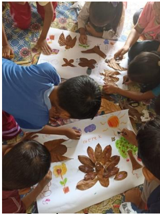
Gambar 2. Proses anak Membuat Kolase Daun Kering