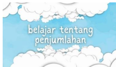
Gambar 2. Menyajikan desain pembukaan video yang menggunakan tema langit cerah untuk memberikan kesan positif

Dalam merancang media pembelajaran, peneliti merancang video animasi secara teliti dengan memperhatikan kesesuaian antara media dan materi penjumlahan soal cerita. Keputusan desain ini didasarkan pada prinsip Multimedia Learning Theory dan pedagogi pendidikan khusus, di mana elemen visual dan auditori disusun sedemikian rupa untuk mengurangi beban kognitif ( cognitive load ) siswa tunagrahita yang memiliki keterbatasan memori kerja. Pada tahapan ini, peneliti merancang desain tampilan awal ( splash screen ), isi materi, dan penutup.