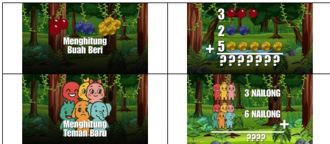
Gambar 3. Desain isi media pembelajaran matematika

Bagian penutup dirancang konsisten dengan tema awal untuk memberikan apresiasi kepada siswa. Gambar 4 menunjukkan tampilan penutup video. Selama tahap perancangan ini, peneliti tidak bekerja satu arah, melainkan melakukan evaluasi formatif terhadap contoh awal ( prototype ) media. Konsultasi informal dengan guru kelas dilakukan untuk mendapatkan umpan balik awal mengenai kesesuaian ilustrasi dengan karakteristik siswa, sehingga penyempurnaan media telah berlangsung secara berulang ( iterative ) bahkan sebelum tahap pengembangan final.