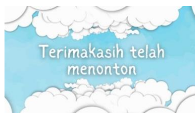
Gambar 4. Desain Penutup Media Pembelajaran Matematika

Bagian penutup dirancang konsisten dengan tema awal untuk memberikan apresiasi kepada siswa. Gambar 4 menunjukkan tampilan penutup video. Selama tahap perancangan ini, peneliti tidak bekerja satu arah, melainkan melakukan evaluasi formatif terhadap contoh awal ( prototype ) media. Konsultasi informal dengan guru kelas dilakukan untuk mendapatkan umpan balik awal mengenai kesesuaian ilustrasi dengan karakteristik siswa, sehingga penyempurnaan media telah berlangsung secara berulang ( iterative ) bahkan sebelum tahap pengembangan final.