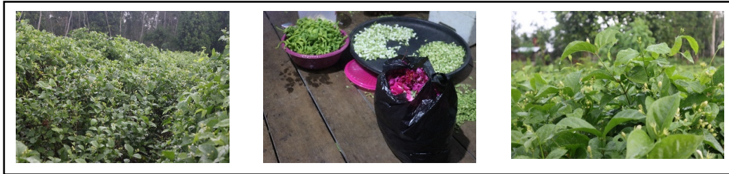
Gambar 2. Bunga Melati Kuncup Segar

Bunga melati yang terdapat di Lok Tangga adalah melati Kampung ( Jasmin sambac ) melati kampung yaitu komoditas pertanian yang sangat mudah berubah kualitasnya sehingga memiliki usia pemasaran yang pendek. Berdasarkan hasil wawancara jenis bunga melati yang diperdagangkan adalah bunga melati segar yang masih kuncup dan dipetik pada pagi hari, sedangkan bunga melati yang sudah mekar atau bunga melati yang sudah jatuh dari tangkai tidak diperjualbelikan. Untuk lebih jelasnya bunga melati yang diperjual belikan dapat dilihat pada Gambar 2.