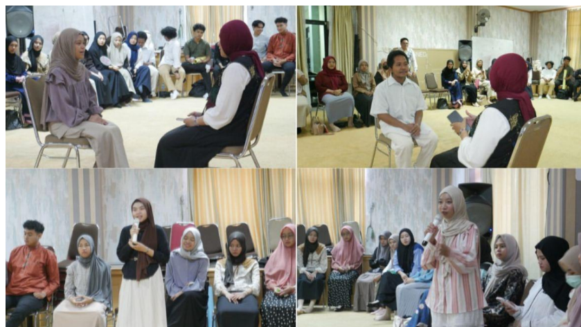
Gambar 3. Simulasi Mock-Up Interview secara Langsung

Gambar 2 menunjukkan kegiatan ditutup dengan sesi dokumentasi bersama seluruh peserta, fasilitator, dan narasumber sebagai bentuk apresiasi atas partisipasi aktif dan semangat belajar yang tinggi.