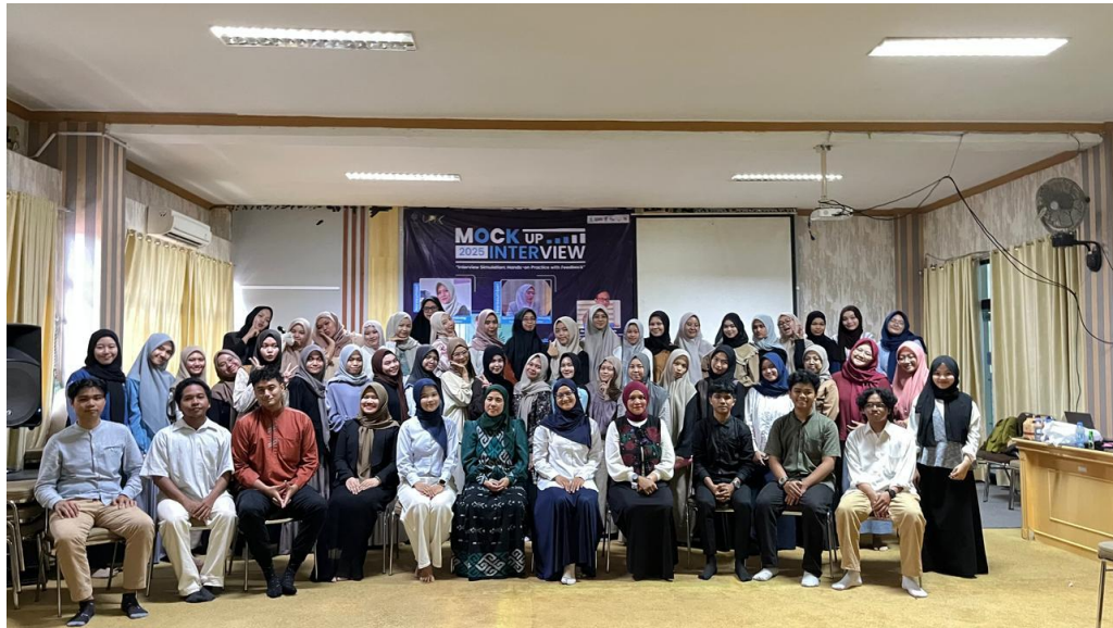
Gambar 2. Foto bersama Peserta dan Narasumber

dan paham tentang ekspektasi dunia kerja yang sesungguhnya. Selain itu, kegiatan ini juga membentuk kesadaran mahasiswa bahwa proses seleksi kerja menuntut penguasaan diri, komunikasi efektif, dan kemampuan membangun citra diri secara positif. Hal ini berperan dalam peningkatan kualitas lulusan ( graduate quality ) yang kini menjadi salah satu indikator keberhasilan institusi pendidikan tinggi. Dengan melihat manfaat yang besar, serta didukung oleh data dan literatur, kegiatan semacam ini sebaiknya terus dilakukan secara berkala dan diperluas cakupannya.