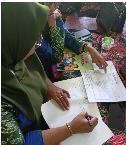
Gambar 5. Pengelola Perpustakaan sedang Membuat Katalog Buku

Setelah data-data bibliografi telah dimasukkan ke dalam buku induk langkah selanjutnya adalah membuat katalog. Katalog adalah kartu berukuran 7,5 cm x 12,5 cm yang didalamnya mencakup data bibliografis yang disusun dengan aturan tertentu yang merupakan wakil dokumen atau wakil buku tersebut dan disusun secara alfabetis (Basuki, 2010). Katalog menjadi alat temu kembali informasi yang sangat dibutuhkan pemustaka ketika mencari koleksi buku di perpustakaan. Kegiatan pendampingan pembuatan buku katalog dapat dilihat pada Gambar 5.