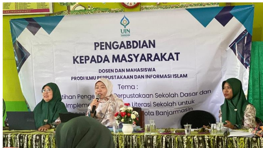
Gambar 3. Penyampaian Materi Pengelolaan Perpustakaan Sekolah Dasar

konsep dan teori manajemen perpustakaan menjadi untuk disampaikan dengan maksud agar pengelola perpustakaan yang notabene guru memiliki dasar pengetahuan tentang konsep manajemen perpustakaan. Pengetahuan ini menjadi langkah awal pengelola perpustakaan melayani kebutuhan pemustaka yang dinamis, penuh rasa ingin tahu, dan menumbuhkan minat baca dengan koleksi perpustakaan yang bisa dilayankan (Suherman, 2009). Untuk penyampaian pengelolaan perpustakaan dapat dilihat pada Gambar 3.