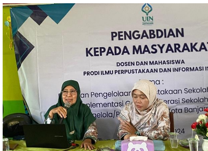
Gambar 2. Penyampaian Materi Implementasi Gerakan Literasi Sekolah

literasi sekolah yang menjelaskan bagaimana konsep dan aplikatif pelaksanaan gerakan literasi sekolah di sekolah dasar pada setiap tahapannya dan disampaikan juga beberapa kegiatan yang bisa mendukung suksesnya penumbuhan kecintaan pada membaca seperti pojok literasi, membaca buku non pelajaran selama 15 menit, mading, pemilihan duta literasi sekolah, dan kegiatan perlombaan yang berkaitan dengan perpustakaan. Beberapa hal yang penting dalam menciptakan ekosistem yang mendukung gerakan literasi sekolah adalah pengkondisian lingkungan yang ramah literasi, semua unsur dari kepala sekolah, guru, staf, pustakawan dan bahkan satpam berupaya membangun kondisi lingkungan sosial yang saling mendukung dalam mengupayakan lingkungan akademik yang literat. Hal ini juga senada dengan hasil pengabdian Juliana et al., (2023) yaitu salah satu kegiatan peningkatan hasil membaca, menulis dan berhitung anak-anak SD Desa Simpang Nadong melalui program rumah literasi. Kegiatan penyampaian materi implementasi gerakan literasi sekolah dapat dilihat pada Gambar 2.