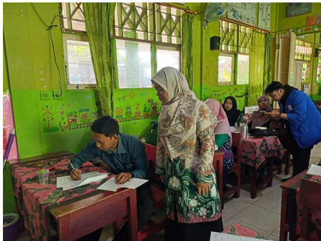
Gambar 4. Dosen dan Mahasiswa Membimbing dalam Memasukkan Data Bibliografis ke dalam Buku Induk

Setelah data-data bibliografi telah dimasukkan ke dalam buku induk langkah selanjutnya adalah membuat katalog. Katalog adalah kartu berukuran 7,5 cm x 12,5 cm yang didalamnya mencakup data bibliografis yang disusun dengan aturan tertentu yang merupakan wakil dokumen atau wakil buku tersebut dan disusun secara alfabetis (Basuki, 2010). Katalog menjadi alat temu kembali informasi yang sangat dibutuhkan pemustaka ketika mencari koleksi buku di perpustakaan. Kegiatan pendampingan pembuatan buku katalog dapat dilihat pada Gambar 5.