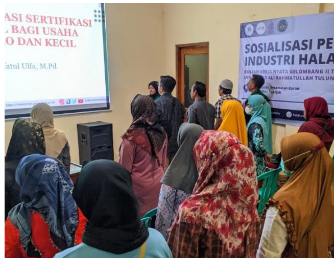
Gambar 4. Kegiatan FGD bersama pelaku UMKM

Peserta yang mengikuti kegiatan sebanyak 52 pelaku UMKM yang mayoritas terjun dalam bidang kuliner atau makanan dan belum bersertifikat halal. Seluruh proses sertifikasi halal yang disampaikan pada FGD bersifat gratis tanpa dipungut biaya supaya meningkatkan semangat pelaku UMKM untuk mendaftarkan legalitas halal produknya masing-masing. Proses pendampingan halal dapat dilakukan dengan mahasiswa KKN UIN Sayyid Ali Rahmatullah Tulungagung sebelum diverifikasi oleh pihak BPJPH.