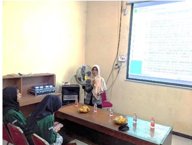
Gambar 2. Kegiatan FGD Sertifikasi Halal

Kegiatan tersebut dihadiri oleh pemerintah kecamatan, pemerintah desa sekaligus para pelaku UMKM setempat.