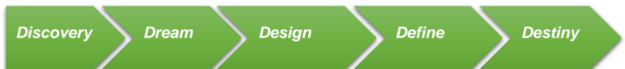
Gambar 1. Metode ABCD

Kegiatan pengabdian dilaksanakan di kecamatan Baron Kabupaten Nganjuk dengan menerapkan metode ABCD. Metode ABCD menurut John McKnight dan Jody Kretzmann dibangun berdasarkan prinsip-prinsip pendekatan berbasis aset membantu sebuah komunitas atau kelompok dalam sebuah masyarakat dalam melihat kenyataan sebuah kondisi internal serta kemungkinan sebuah perubahan yang dapat diterapkan, selain itu pendekatan tersebut mengarahkan pada perubahan ke hal yang positif, fokus pada tujuan yang ingin dicapai oleh sebuah komunitas, serta membantu sebuahn komunitas untuk mewujudkan visi yang telah direncanakan sebelumnya (Rinawati & Arifah, 2022). Pendekatan ABCD dikenal juga sebagai pendekatan berbasis aset. Pendekatan ABCD memiliki tujuan untuk menciptakan sebuah kesadaran pada masyarakat akan asset yang dimilikinya (Kamelia & Pawhestri, 2021).