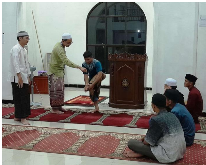
Gambar 2. Kegiatan Pembinaan Muallaf di Mesjid Ar-Rahim

Fokus utama adalah memberikan pendampingan pada muallaf dalam membaca huruf hijaiyah dan memahami tartil membaca Al-Qur'an. Program ini diteruskan secara berkelanjutan agar kemampuan membaca Al-Qur'an secara tartil dapat terus meningkat. Sebaik-baiknya manusia adalah orang yang belajar al-Qur'an dan mengajarkannya (Safliana, 2020). Harapan utama adalah agar muallaf dapat menjadi pengajar bagi yang lainnya, menciptakan lingkungan belajar yang berkelanjutan.