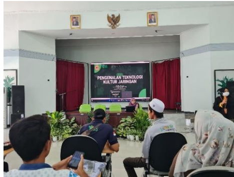
Gambar 1. Sosialisasi dan FGD tentang Pengenalan Kultur Jaringan

Kegiatan sosialisasi dilanjutkan dengan Focus Group Discussion (FGD) agar peserta dapat langsung bertanya dan diskusi terkait kultur jaringan sebelum terjun ke praktik laboratorium. Dalam sesi ini dipamerkan beberapa hasil kultur jaringan yang dapat memberi gambaran awal bagi para peserta dan memicu pertanyaan-pertanyaan dari wirausahawan tani yang tertarik.