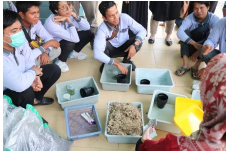
Gambar 3. Demosntrasi dan Praktik Pemisahan Planlet dan Aklimatisasi

Peserta diberikan penjelasan tentang prosedur aklimatisasi, dan praktik langsung pemisahan planlet dilakukan pada bahan yang sudah tersedia di laboratorium SMK-PP Negeri Banjarbaru (Gambar 3).