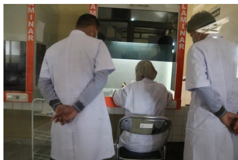
Gambar 2. Praktik Penanaman Eksplan pada Media Nutrisi di dalam LAF

Kegiatan pelatihan kultur jaringan dimulai dengan prosedur sterilisasi peralatan, persiapan eksplan/ bahan tanam dan pembuatan media kultur. Dalam pelatihan ini para peserta diberi penekanan bahwa kondisi aseptis sangat penting dijaga. Sukses pekerjaan kultur jaringan sangat dipengaruhi oleh kemampuan pekerja menjaga kondisi aseptik (Dwiyani, 2015; Cahyono & Ningsih, 2021; Shofiyani & Damajanti, 2015).