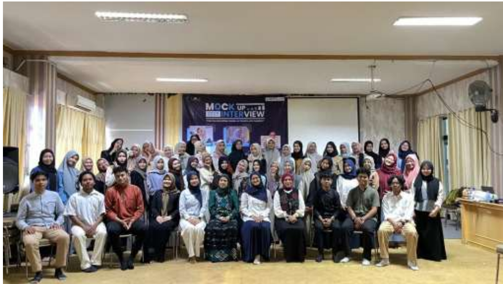
Gambar 2. Foto bersama Peserta dan Narasumber

dan paham tentang ekspektasi dunia kerja yang sesungguhnya. Selain itu, kegiatan ini juga membentuk kesadaran mahasiswa bahwa proses seleksi kerja menuntut penguasaan diri, komunikasi efektif, dan kemampuan membangun citra diri secara positif. Hal ini berperan dalam peningkatan kualitas lulusan ( graduate quality ) yang kini menjadi salah satu indikator keberhasilan institusi pendidikan tinggi. Dengan melihat manfaat yang besar, serta didukung oleh data dan literatur, kegiatan semacam ini sebaiknya terus dilakukan secara berkala dan diperluas cakupannya.