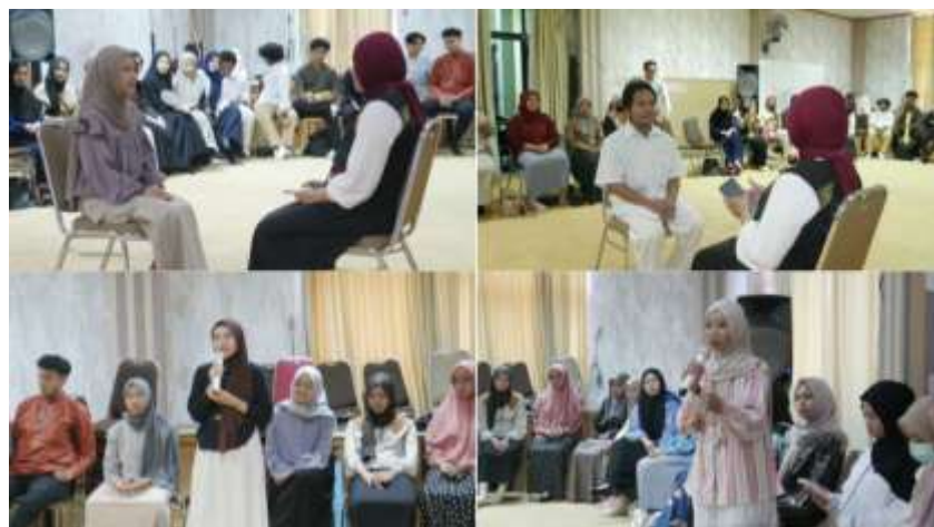
Gambar 3. Simulasi Mock-Up Interview secara Langsung

Gambar 2 menunjukkan kegiatan ditutup dengan sesi dokumentasi bersama seluruh peserta, fasilitator, dan narasumber sebagai bentuk apresiasi atas partisipasi aktif dan semangat belajar yang tinggi.