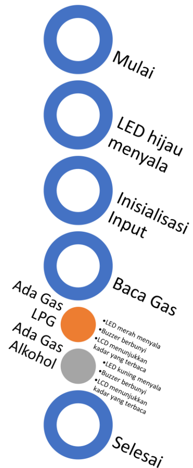
Gambar 3. Diagram Alur Sistem

Pemrograman akan menggunakan software Arduino v. 1.8.18 dengan bahasa pemrograman C++. Dengan alur program adalah tampak pada Gambar 3.