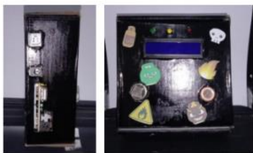
Gambar 4. Alat Pendeteksi Kebocoran Gas Penyebab Kebakaran

Pada proses perancangan alat didapat hasil nyata dari desain alat pendeteksi kebocoran gas penyebab kebakaran dengan kemasan yang menarik seperti gambar berikut