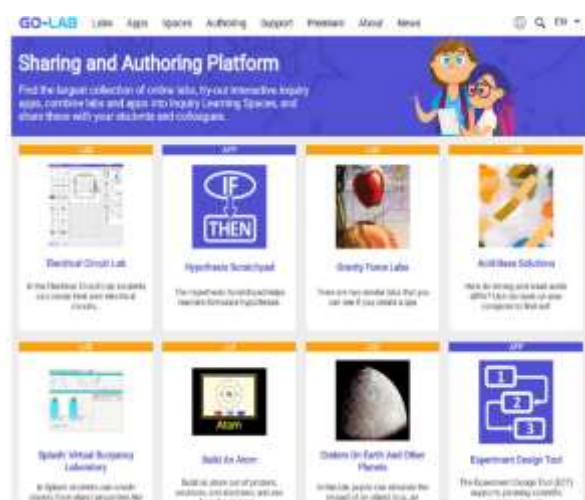
Gambar 1. Tampilan Awal Go-Lab

universitas, institusi, dan organisasi penelitian ternama seperti European Space Agency (ESA), European Organization for Nuclear Research (CERN), dan Astronomical Observatory of Coimbra's University (OGA). Selain itu, Platform ini juga mencakup aplikasi pembelajaran yang mendukung penyelidikan dan pembelajaran kolaboratif, penilaian, dan penggunaan analisis pembelajaran (Chitiyo dkk. 2020).