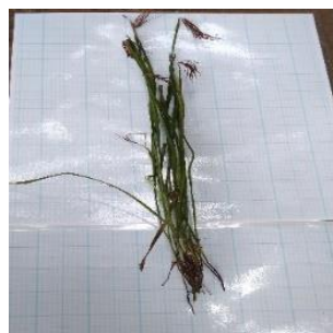
Gambar 10. Actinostachys digitata

Actinostachys digitata yang dikenal sebagai pakis rumput atau paku rimba merupakan spesies pakis kecil yang memiliki daun tegak mirip rumput (Walker, 2022). Pelepahnya