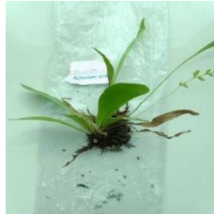
Gambar 9. Asplenium nidus

Asplenium nidus menghasilkan daun besar yang sederhana, mirip dengan penampilan daun pisang, dengan panjang mencapai 50–150 sentimeter (20–59 inci) dan lebar 10–20 sentimeter (3,9–7,9 inci). Beberapa individu bahkan dapat tumbuh hingga mencapai panjang dua meter (6,6 kaki) dan lebar 61 sentimeter (dua kaki). Warna hijau muda daun ini sering kali berkerut, dilengkapi dengan pelepah hitam, dan menampilkan vernasi melingkar. Spora Asplenium nidus berkembang di sori yang membentuk barisan panjang di bagian bawah daun, terletak di belakang lamina bagian luar. Saat daun ini berubah warna menjadi coklat, mereka menggulung ke belakang dan membentuk sarang daun besar di dahan dan batang pohon (Chen, dkk., 2023).