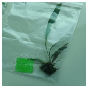
Gambar 3. Microsorium sp.

Microsorium sp. termasuk dalam kelompok paku-pakuan sejati, dengan mayoritas anggotanya tumbuh merambat pada batang pohon (epifit) atau bebatuan (litofit) (Karim, dkk., 2022). Sebagian jenis Microsorium dapat ditemui tumbuh di dalam air mengalir sebagai habitatnya, baik itu di kolam, bagian sungai dangkal, maupun di hutan yang lembab. Daun pada Microsorium sp. memiliki bentuk memanjang menyerupai lidah dengan peruratan yang terlihat jelas. Dalam penanamannya di akuarium, rimpang Microsorium sp. dapat diikat pada batu atau penyangga lain, menciptakan kondisi semacam epifit.