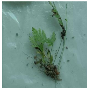
Gambar 11. Crepidomanes bipunctatum

Spesies Crepidomanes bipunctatum , yang juga dikenal sebagai Trichomanes bipunctatum , merupakan tumbuhan paku epifit yang umumnya tumbuh di batang pohon atau permukaan batu yang lembab (Plunkett, dkk., 2022). Tumbuhan ini menampilkan daun kecil, transparan, berbentuk hati, dengan dua bintik gelap yang terletak di tengahnya. Adapun struktur seperti rizoid membantu dalam penyerapan air dan nutrisi, sedangkan sporangium berperan dalam proses reproduksi. Crepidomanes bipunctatum cenderung menunjukkan adaptasi yang baik terhadap lingkungan epifitiknya (Krishnan & Rekha, (2021).