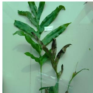
Gambar 7. Drynaria sparsisora

Spesies Drynaria sparsisora , atau yang dikenal juga dengan nama Aglaomorpha sparsisora , merupakan sejenis tumbuhan paku yang termasuk dalam famili Polypodiaceae. Tumbuhan ini memiliki rimpang tegak dengan pangkal yang mengecil dan bersisik padat, dan daunnya berjenis dimorfik, pinnatifid, dapat tumbuh hingga 60-70 cm (Baroro & Sabasales, 2024). Drynaria sparsisora dapat hidup sebagai epifit atau di tempat yang teduh, dan dapat dimanfaatkan sebagai tanaman hias maupun bahan kerajinan tangan.