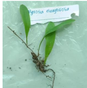
Gambar 8. Pyrrrosia eleagnifolia

Tumbuhan paku memiliki siklus hidup yang melibatkan dua tahap utama, yaitu tahap sporofit dan tahap gametofit. Tahap sporofit adalah tahap tumbuhan yang tampak, yang menghasilkan spora melalui organ sporangium. Spora kemudian tumbuh menjadi tahap gametofit, yang lebih kecil dan tersembunyi. Gametofit menghasilkan sel-sel reproduksi yang disebut gamet (Karim, dkk., 2022).