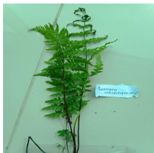
Gambar 4. Rumohra adiantiformis

Rumohra adiantiformis , yang memiliki tangkai berukuran 12-24 inchi dan lebar 5-8 inchi, menampilkan daun menyirip yang mengkilap dengan warna hijau gelap. Batangnya kuat dan fleksibel, dengan warna coklat di bagian pangkal, serta memiliki vaselifa yang berlangsung