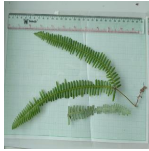
Gambar 12. Dicranopteris linearis

Jenis tumbuhan paku Dicranopteris linearis , yang juga dikenal sebagai pakis resam, memiliki ciri khas percabangan yang unik, membedakannya dengan jelas dari jenis paku lainnya. Setiap cabangnya bercabang dua, dan setiap cabang tersebut terus bercabang dua, sehingga seluruh tumbuhan ini menutupi tanah di area pertumbuhannya. Karakteristik inilah yang membuat Dicranopteris linearis mendominasi suatu daerah tanpa adanya jenis paku lainnya (Ramya, dkk., 2021).