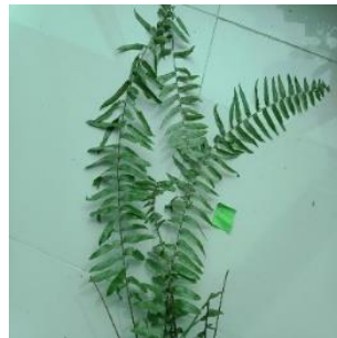
Gambar 2. Parablechnum minus

Parablechnum minus yang juga dikenal sebagai paku air merupakan jenis tanaman paku kecil yang tumbuh di lingkungan lembab dengan berbagai habitat, sering ditemui di sepanjang aliran sungai. Untuk pertumbuhannya yang optimal, Parablechnum minus memerlukan tanah yang secara konsisten lembab dan paparan sinar matahari yang redup. Tanaman ini dapat tumbuh dari spora. Dibandingkan dengan Parablechnum novae-zelandiae , Parablechnum minus memiliki pelepah yang lebih kecil dan lebih halus, serta skala berwarna coklat muda secara merata. Namanya yang lain, yaitu paku air, merujuk pada keberadaannya yang sering ditemukan di sekitar air (Brownsey & Perrie, 2019).