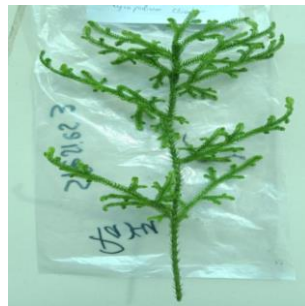
Gambar 13. Palhinhaea cernua

Tumbuhan paku merupakan kelompok tumbuhan yang termasuk dalam divisi