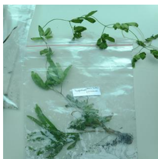
Gambar 5. Lygodium flexuosum

Lygodium flexuosum , juga dikenal sebagai Ribu-ribu Gajah, adalah sejenis pakis asli yang memanjat di Singapura. Tanaman ini memiliki rimpang yang menjalar pendek, ditutupi dengan rambut berwarna coklat hingga hitam, dan cabang primer rimpang yang sangat pendek, hanya mencapai 3 mm. Cabang sekunder menyirip hingga bipinnate, memegang trilobed, dan memiliki bentuk panah hingga selebaran sederhana dengan tepi bergigi. Struktur yang mengandung spora menonjol di sepanjang tepi lobus pelepah yang subur.