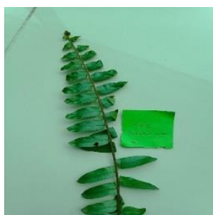
Gambar 1. Parablechnum procerum

Parablechnum procerum dikenal juga sebagai paku kinca adalah jenis pakis yang umumnya mencapai tinggi antara 30 hingga 50 cm. Tanaman ini dapat ditanam dengan mudah melalui spora segar atau tanaman utuh, serta berhasil ditransplantasikan dengan baik.