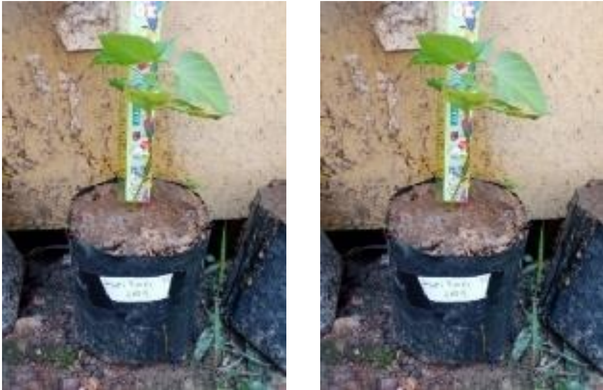
Gambar 7. (kiri) pupuk pertama (kanan) pupuk kedua