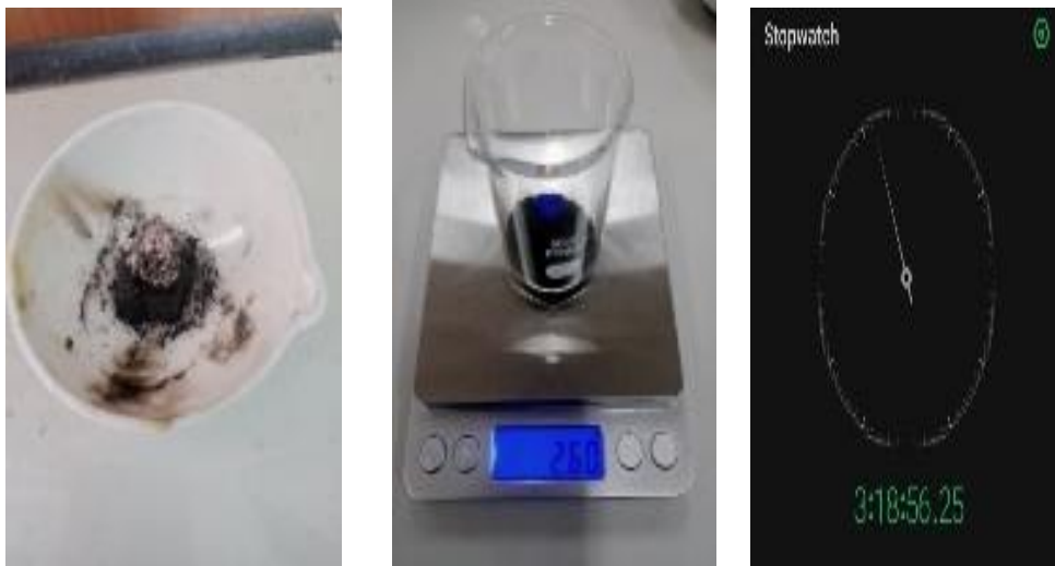
Gambar 5. Proses Uji Laju Pembakaran

Briket yang sudah didapatkan selanjutnya dilakukan uji laju pembakaran. Uji ini dilakukan dengan membakar briket untuk mengetahui waktu nyala, kemudian melakukan penimbangan briket yang sudah dibakar, proses uji laju pembakaran seperti Gambar 5.