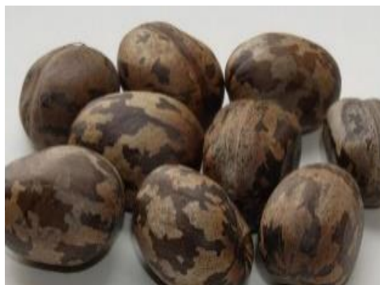
Gambar 1. Biji karet

Karet merupakan salah satu komoditas perkebunan unggulan yang berperan penting dalam perekonomian nasional. Provinsi Kalimantan Selatan termasuk sebagian sentra produksi karet di Indonesia dengan luas lahan mencapai 272.177 ha dan hasil produksi sebesar 205.203 ton pada tahun 2021. Getah karet masih menjadi komoditas utama dalam pemanfaatan pohon karet. Pengolahan tanaman karet saat ini masih menitikberatkan pemanfaatan getahnya saja.