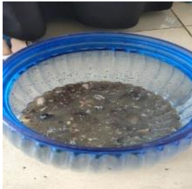
Gambar 6. Pupuk Organik Cair

Proses pengolahan ampas menjadi pupuk yaitu dengan mengumpulkan ampas karet dari proses pengepresan, pupuk dibuat dengan memvariasikan komposisi bahan yaitu pupuk pertama terdiri ampas biji karet dan larutan EM4 sedangkan pupuk kedua terdiri dari ampas biji karet, kotoran ayam, dan larutan EM4 pupuk yang dihasilkan seperti Gambar 6.