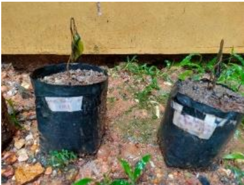
Gambar 8. Kondisi Tanaman Cabai yang Diaplikasikan Pupuk

Hasil yang didapatkan ini tidak sesuai dengan asumsi awal yang menyebutkan bahwa pupuk yang dihasilkan bisa menyuburkan tanaman cabai. Hal ini disebabkan oleh berbagai faktor yaitu peletakan tanaman cabai yang kurang sesuai, kandungan zat toksik pada biji karet masih terdapat pada ampas biji karet atau terdapat kandungan yang kurang sesuai dengan zat