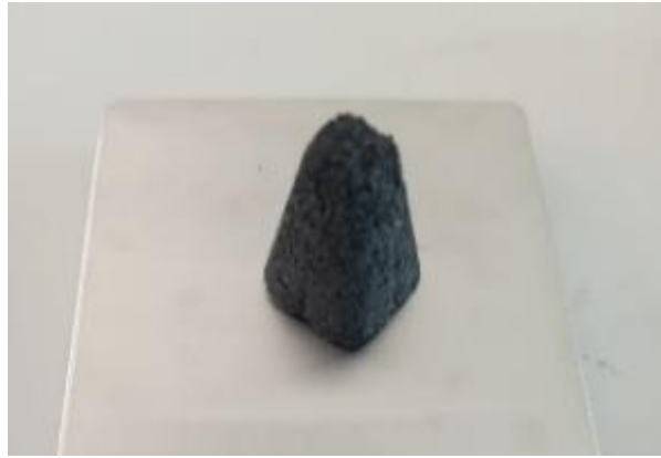
Gambar 4. Briket

Briket yang sudah didapatkan selanjutnya dilakukan uji laju pembakaran. Uji ini dilakukan dengan membakar briket untuk mengetahui waktu nyala, kemudian melakukan penimbangan briket yang sudah dibakar, proses uji laju pembakaran seperti Gambar 5.