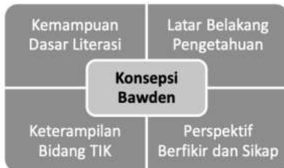
Gambar 1 Konsepsi literasi digital Bawden

Pembentukan literasi digital dipengaruhi oleh 4 aspek yang disusun dalam konsepsi Bawden (Lankshear, Michele, and Editors 2008). Empat aspek tersebut yaitu kemampuan dasar literasi, latar belakang pengetahuan informasi, keterampilan di bidang Teknologi Informasi Komunikasi, serta perspektif berfikir dan sikap. Kemampuan dasar literasi merupakan kemampuan untuk membaca, menulis, memahami simbol, dan perhitungan angka. Hal ini menunjukkan kemampuan dalam memahami dan menggunakan simbol-simbol yang digunakan pada perangkat lunak di media digital. Aspek kedua yaitu latar belakang pengetahuan informasi, yaitu kemampuan menggunakan pengetahuan yang telah dimiliki untuk menelusuri informasi baru yang memperkaya pengetahuan yang dimiliki sebelumnya, hal ini ditunjukkan dalam kemampuan mencari informasi menggunakan search engine dan menyeleksi hasil pencarian. Aspek keterampilan bidang Teknologi Informasi Komunikasi merupakan kompetensi utama dalam bidang literasi digital, dimana seseorang memiliki kemampuan untuk menciptakan atau menyusun konten digital. Aspek terakhir yaitu aspek sikap dan perspektif pengguna informasi ( attitudes and perspective ), merupakan perilaku seseorang dalam menggunakan informasi dan mengkomunikasikan konten informasi.