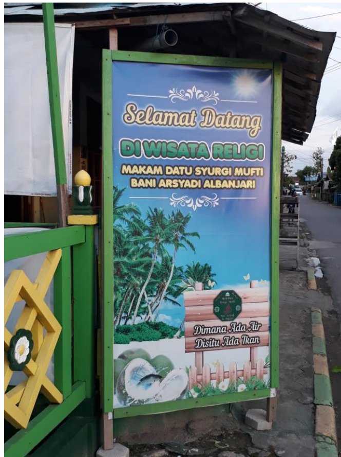
Gambar 6 Media papan reklame bertuliskan ucapan selamat datang