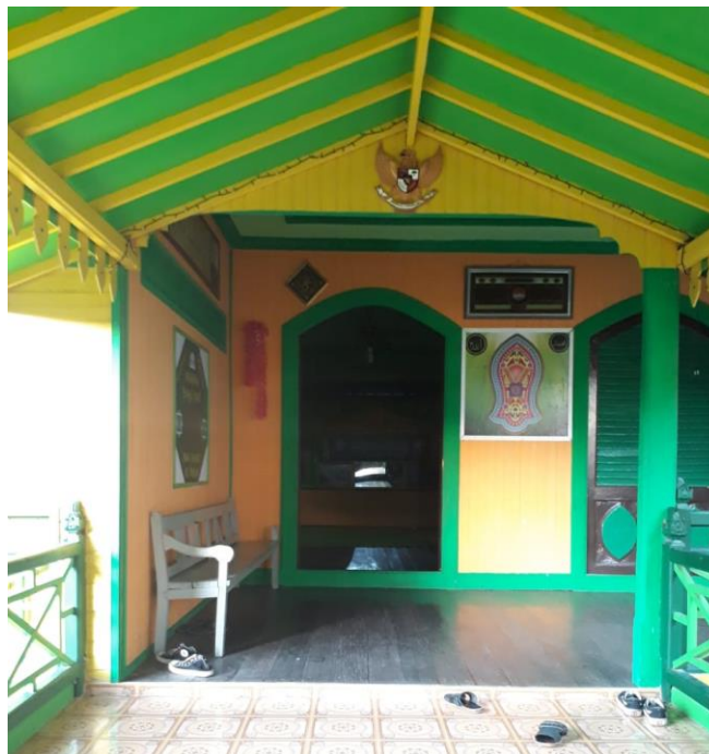
Gambar 4 Rumah Syekh Surgi Mufti yang berada di belakang makam