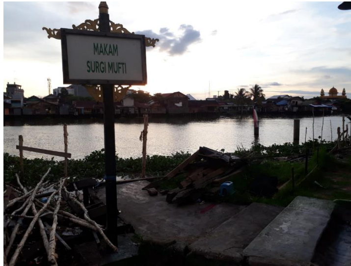
Gambar 5 Petunjuk sebagai tanda/identitas makam yang berada dekat dengan sungai. Di atas sungai tersebut sudah berdiri tiang untuk membangun Musholla Terapung