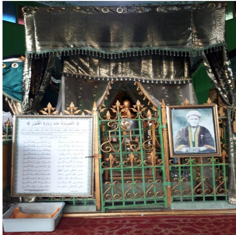
Gambar 3 Makam Syekh Surgi Mufti