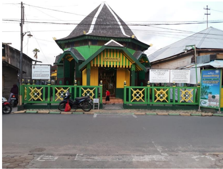
Gambar 2 Kubah Syekh Surgi Mufti di kawasan Jalan Mesjid Jami, Kelurahan Surgi Mufti, Kecamatan Banjarmasin Utara, Kota Banjarmasin

Dinas Pariwisata Kalimantan Selatan dapat melakukan bauran promosi personal selling melalui duta wisata. Duta wisata merupakan figure pariwisata yang merupakan perpanjangan tangan pemerintah yang tugasnya memperkenalkan dan mempromosikan potensi budaya dan pariwisata tertentu. Tujuannya adalah untuk menjaring lebih banyak para wisatawan local maupun asing untuk datang ke wilayah tertentu. 100 Berdasarkan pada definisi dan tujuan duta wisata ini, maka duta wisata dapat mempromosikan kepada siapapun, terlebih kepada para wisatawan tentang Makam Syekh Surgi Mufti sebagai wisata religi yang ditawarkan Kalimantan Selatan.