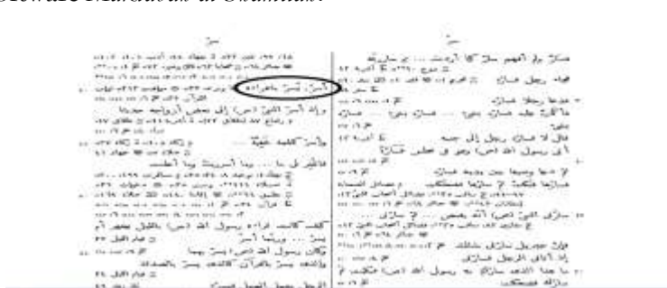
Rajah 1.3 Rujukan Kitab al-Mu'jam al-Mufabras Halaman 446

Sebagai contoh, pengkaji menggunakan dua pendekatan dalam pencarian takhrij hadith iaitu dengan melihat kepada kitab al-Mu'jam al-Mufabras li al-Alfaz al-Hadith al-Nabawiyy karangan A.J. Wensinck dan juga melihat kepada software Maktabah al-Shamilah .