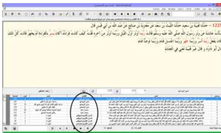
Rajah 1.4 software Maktabah al-Shamillah

Dalam kitab tersebut mengumpulkan hadith-hadith yang ingin dicari dengan dikumpulkan secara ringkasan sebagai contoh (٣) membawa maksud riwayat Abu Dawud, (٤) membawa maksud riwayat al-Tirmidhiyy, dan (٥) membawa maksud riwayat Ahmad bin Hanbal.