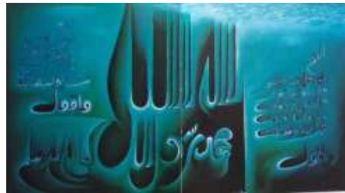
Lukisan Sebahagian Do'a Akasyah