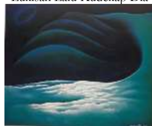
Lukisan Pegunungan Cangar