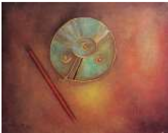
Lukisan Simbol Purba II