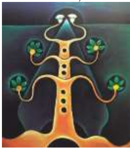
Lukisan Pohon Kehidupan dan Dua Bunga