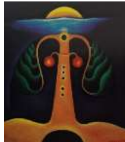
Lukisan Pohon Kehidupan dan Dua Buah