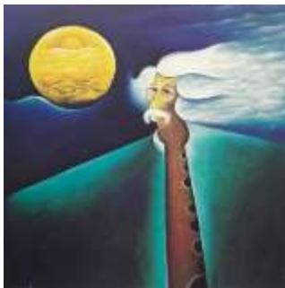
Lukisan Potret Diri