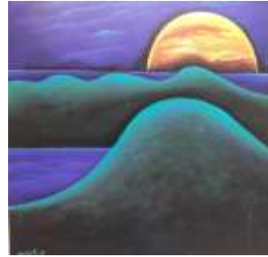
Lukisan Impresi Lasem I