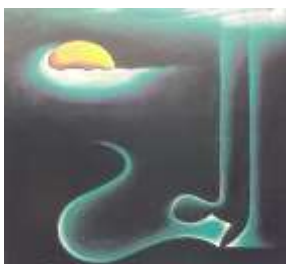
Lukisan Alif Laam Mim