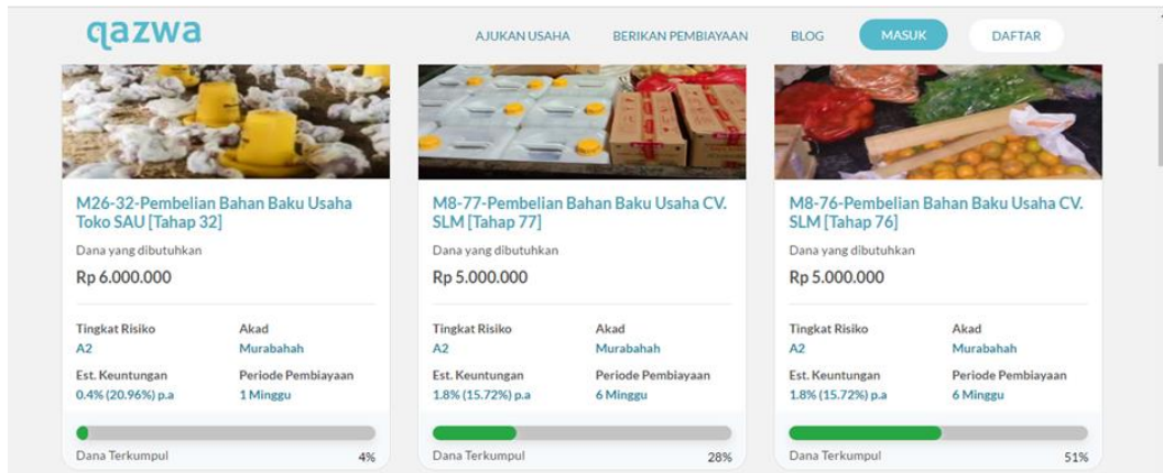
Gambar 3. Marketplace untuk Memilih Target Pendanaan di Qazwa

Ada 2 akad yang digunakan Qazwa untuk menunjang transaksinya, yaitu akad murabahah dan akad mudharabah . Akad murabahah digunakan untuk pembelian barang/bahan baku produksi dengan tambahan keuntungan (margin) yang disepakati, sedangkan akad mudharabah digunakan untuk melaksanakan aktivitas operasional bisnis. 20 Perjanjian antara pendana dengan Qazwa maupun Qazwa dengan penerima pembiayaan dibuat secara tertulis dalam bentuk akad baku yang dapat diakses dan diunduh dengan mudah, baik oleh pengguna maupun pengujungnya. 21