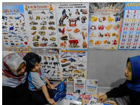
Gambar 2. Peran Orang Tua Dalam Memberikan Fasilitas Buku

Dengan adanya keadaan di atas untuk mengenalkan atau mengembangkan literasi pada anak, maka diperlukan peran dari keluarga terdekat yakni orang tua, karena secara keseluruhan orang tua memiliki peran penting dalam perkembangan dan pendidikan anak-anak. Begitu juga anak-anak akan dengan mudah meniru hal-hal yang ada di sekitar mereka, termasuk kebiasaan orang tua mereka. Salah satunya adalah kebiasaan untuk membaca. Orang tua yang suka membaca akan diikuti oleh anak-anaknya secara bertahap, sehingga akan berubah menjadi kebiasaan anak-anak.