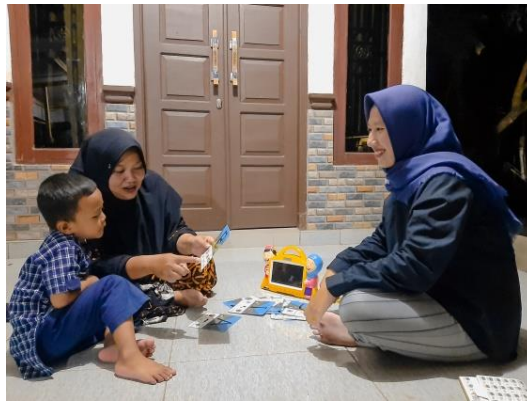
Gambar 3. Peran Orang Tua Dalam Memberikan Fasilitas Media Digital

bermain. Sebagaimana pendapat Hapsari et al (2017: 179) bahwa kemampuan literasi awal merupakan pengetahuan, sikap dan keterampilan seorang anak usia dini yang berkaitan dengan membaca dan menulis sebelum menguasai kemampuan formal pada usia sekolah. Komponen-komponen literasi awal, yaitu minat membaca, kemampuan bahasa, kesadaran fonologis, kemampuan membaca, dan kemampuan menulis.