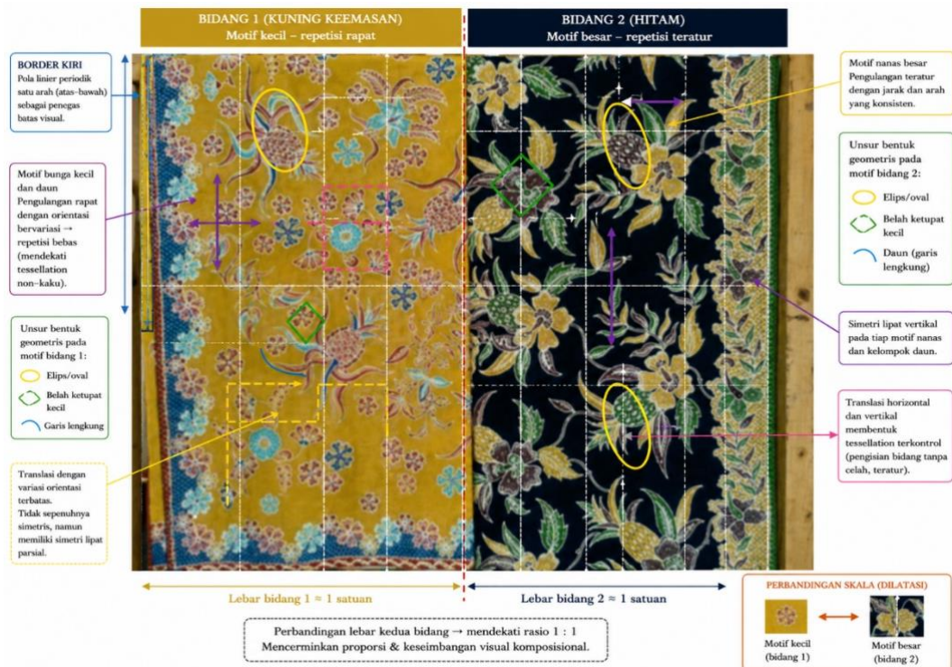
Gambar 2. Motif Batik Ganasan 2

Gambar 2 menunjukkan motif Batik Ganasan 2 khas Subang yang tersusun atas dua bidang utama vertikal dengan latar warna kontras, yaitu kuning keemasan pada bidang kiri dan hitam gelap pada bidang kanan. Kedua bidang tersebut membentuk satu kesatuan visual melalui pengulangan motif nanas, bunga, dan daun dengan karakter pola yang berbeda. Secara struktural, kain batik terbagi menjadi dua subbidang dengan lebar yang relatif seimbang sehingga menunjukkan penerapan konsep partisi bidang datar, rasio, dan proporsi visual yang mendekati perbandingan 1:1. Selain itu, keberadaan border sempit pada sisi kiri dan sisi kanan bidang hitam berfungsi sebagai batas visual sekaligus mempertegas komposisi antarbidang.