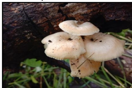
Gambar 9. Pleurotus pulmonaris

Jamur Pleurotus pulmonaris saat ditemukan peneliti dilapangan berupa jamur yang masih muda dengan kondisi segar, tubuh buah besar, permukaannya halus mengkilat, bagian tepi bergelombang, dan berminyak. bentuk tudung seperti payung dengan permukaan tudung halus. Berbentuk ada yang agak cembung, tetapi ada juga yang bentuknya rata atau sedikit cekung.