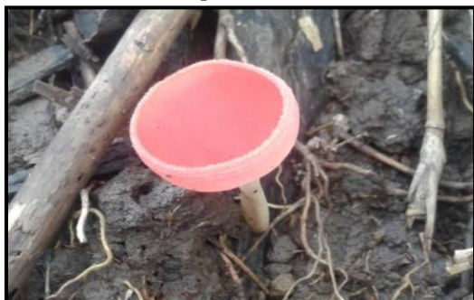
Gambar 15. Cookeina sulcipes

Jamur Cookeina sulcipes yang ditemukan peneliti merupakan jamur yang tergolong ke dalam famili Sarcosyphaceae yang merupakan anggota dari ordo Pezizales. Jamur Cookeina sulcipes memiliki bentuk tubuh buah seperti cangkir atau mangkuk. Jamur ini berwarna cerah seperti merah muda sampai merah ketika dewasa. Terdapat pada sekeliling bagian atas tudung ditemukan adanya bulu-bulu halus. Jamur Cookeinasulcipes memiliki permukaan tudung yang licin dan halus di bagian dalam. Jamur ini tumbuh secara berkelompok dan tersebar diserasah seperti kulit pohon, cabang, dan ranting. Sehingga ordo ini dikenal memiliki anggota yang hidup sebagai