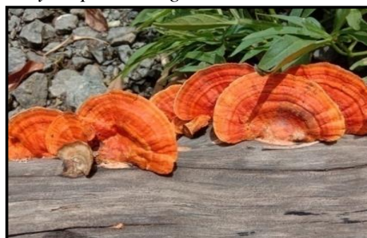
Gambar 3. Pycnoporus sanguineus

Jamur Pycnoporus sanguineus yang ditemukan peneliti sering disebut dengan jamur merah karena sering ditemui saat muda dengan warna kuning kemerah-merahan atau jingga terang. Namun saat sudah dewasa maka