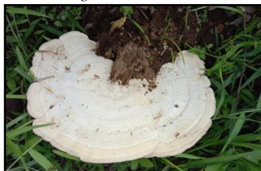
Gambar 5. Trametes gibbosa

Jamur yang ditemukan peneliti merupakan spesies dari Ordo Polyporales . Memiliki bentuk setengah lingkaran dengan bagian tepi tidak beraturan. Jamur ini berwarna putih dan terdapat garis samar-samar kecoklatan seperti lingkaran tahun. Permukaan atas halus dan berwarna abu-abu keputihan. Saat sudah tua dapat ditemui warna yang kehijauan pada spesimen karena pada