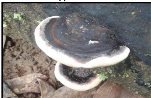
Gambar 8. Ganoderma applanatum

Jamur Ganoderma applanatum yang ditemukan oleh peneliti ini memiliki bentuk tubuh yang keras dengan warna kehitaman dan bagian pinggirnya berwarna putih. Memiliki