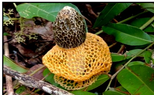
Gambar 1. Phallus indusiatus

Jamur Phallus indusiatus yang ditemukan memiliki jaring-jaring halus berwarna kuning diatas serasah tanah secara soliter. Bentuk tubuh membuat sebagian dasarnya dan permukaan yang bersisik halus. Permukaan tudungnya berwarna kecokelatan dengan mengeluarkan lendir yang berbau seperti bangkai.