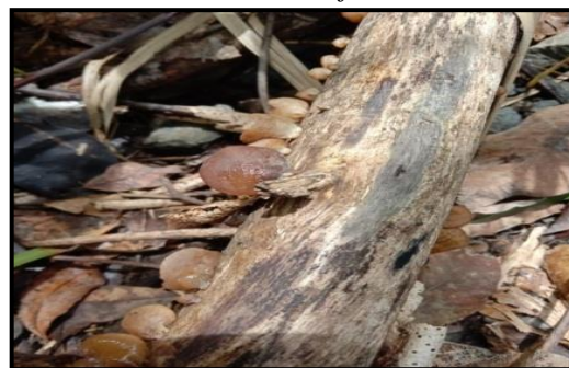
Gambar 13. Auricularia auricula-judae

Jamur Auricularia auricula-judae yang ditemukan peneliti memiliki nama perubahan seperti Auricularia