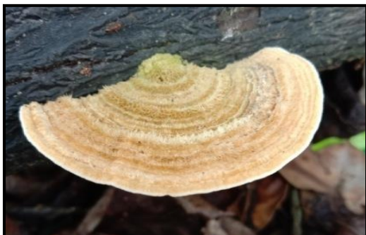
Gambar 4. Trametes hirsute

Jamur yang ditemukan peneliti memiliki bentuk seperti kipas atau ginjal. Permukaan badan buah bergaris-garis dengan tekstur keras yang menyerupai kulit. Pada badan buah terlihat berwarna cokelatan muda. Permukaan badan buah dengan kasar yang terdapat bulu-bulu halus. Tidak memiliki tangkai buah sehingga melekat pada substrat dan tipe akar semu rizhoid . Jamur ini banyaktumbuh secara soliter atau berkoloni. Habitat jamur pada batang kayu yang lapuk dan posisi tumbuhnya sering tumpang tindih. Jamur ini tidak dapat dikonsumsi, tetapi berfungsi dalam proses pelapukan pada kayu. Sehingga jamur ini memiliki peranan sebagai saprofit dilingkungan. Hal ini sesuai dengan pendapat Zulpitasari (2019) bahwa jamur yang hidup pada habitat tanah, serasah, pada batang pohon, kayu lapuk, dan kayu mati sebagai saprofit.