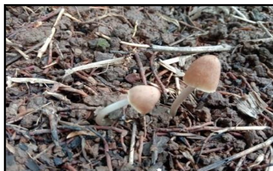
Gambar 11. Parasola auricoma