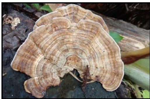
Gambar 6. Trametes ochracea

Jamur Trametes ochracea yang ditemukan peneliti termasuk dalam famili Polyporaceae dari ordo Polyporales. Jamur Trametes ochracea memiliki tubuh buah berbentuk setengah lingkaran tidak beraturan atau kipas dengan tepi bergelombang dan terdapat zonasi pertumbuhan. Jamur ini berada pada posisi lateral, permukaan atas berwarna coklat muda dan dibagian tepi berwarna putih. Pada bagian