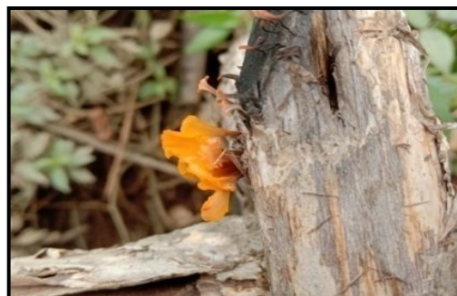
Gambar 14. Dacryopinax spathularia

Jamur ditemukan memiliki nama perubahannya Dacryopinax elegans . Jamur ini bertekstur kenyal seperti jeli, memiliki tubuh buah berbentuk seperti kipas pipih atau spatula, dan berwarna jingga cerah saat muda dan kemudian menjadi lebih oranye kemerahan saat dewasa. Bentuk yang sangat unik tersebut membuat jamur Dacryopinax spathularia sangat mudah dikenali apabila tumbuh di sekitar lingkungan walaupun berukuran kecil. Jenis jamur ini bersifat saprofit dengan hidup menempel langsung pada substrat nya. Jamur ini biasanya hidup dalam kelompok yang cukup besar. Biasanya ditemukan pada kayu yang lapuk/mati.