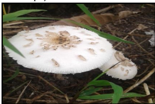
Gambar 12. Chlorophyllum brunneum

Jamur Chlorophyllum brunneum yang ditemukan tumbuh secara