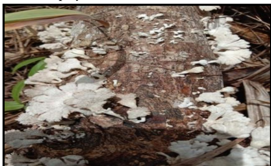
Gambar 10. Schizophyllum commune

Jamur Schizophyllum commune yang ditemukan peneliti ini memiliki nama daerah dengan sebutan Kulat Krikrit atau Kulat Kritip (Dayak). Jamur Schizophyllum commune memiliki tubuh buah seperti kipas, berdaging dan elastis. Memiliki warna abu-abu dengan permukaan tudung berbulu panjang dan bagian tepinya terbelah. Bentuk bilah bercabang ketepi dan letak tubuh buah pileus pada posisi sessile . Permukaan jamur pada bagian atas kasar berserabut