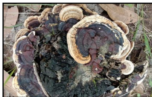
Gambar 7. Earliella scabrosa

Jamur Earliella scabrosa yang ditemukan peneliti yaitu berbentuk setengah lingkaran. Berwarna coklat kehitaman dan tepinya berwarna putih. Bagian bentuk tepi mendatar dengan permukaan bergelombang. Pada bagian atas berwarna kusam dan bagian bawah terdapat pori-pori halus. Tekstur tubuh jamur keras seperti kayu. Namun ketika